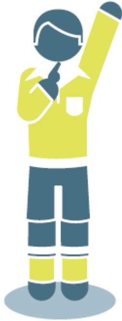
Tiro libre indirecto