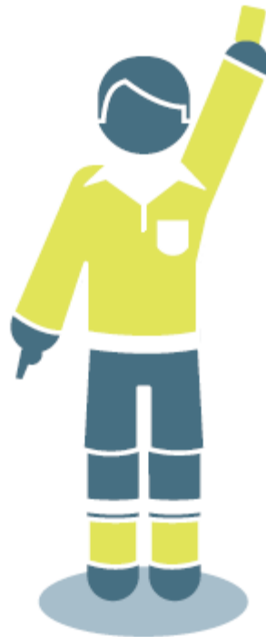
Chequeo: un dedo a la oreja con la otra mano o el otro brazo extendido