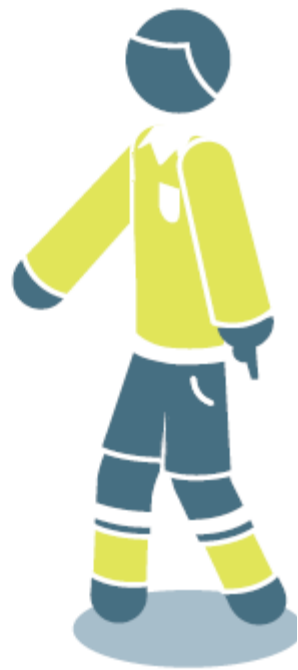
Saque de meta