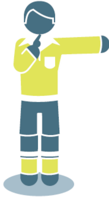
Tiro libre directo