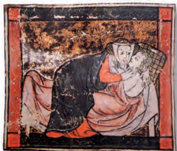
Miniatura das Cantigas de Santa María de Afonso X o Sabio

A lírica trobadoresca galego-portuguesa constitúe a expresión artística máis notable da comunidade lingüística e cultural de Galicia e Portugal na Idade Media. Con raíces na tradición autóctona da vella Gallaecia (que abranguíu o territorio da Galicia actual e de Portugal ata o río Douro), inspirada polo exemplo do trobadorismo occitano, o seu brillo irradiará polos catro cantos da Península, como poñen de manifesto as cortes e as obras poéticas dos reis Afonso X o Sabio e don Denis de Portugal.