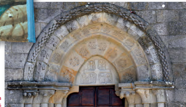
Tímpano de Santa María de Castrelos