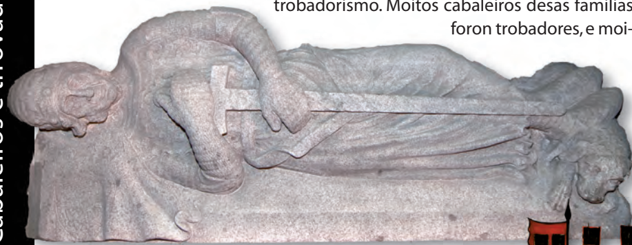
Sartego de Pedro Froilaz, conde de Traba. Capela Real, catedral de Santiago de Compostela

A lírica trobadoresca é unha baril manifestación da puxante vitalidade cultural da sociedade galega da Idade Media, especialmente da súa nobreza. As familias nobiliarias de Galicia e o norte de Portugal (como os Traba e os Sousa), estreitamente unidas entre si, constituíron a base fundamental do trobadorismo. Moitos cabaleiros desas familias foron trovadores, e moi-