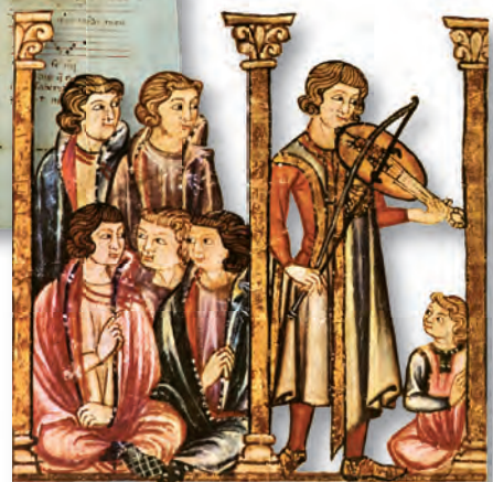
Miniatura das Cantigas de Santa María de Afonso X o Sabio