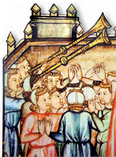
Miniatura das Cantigas de Santa María

santuario, de sabor popularizante, ambientadas arredor dun lugar sagrado como lugar de encontro de mozas e namorados. As cantigas de santuario son un fenómeno tipicamente galego, con especial arraigo na Galicia suroccidental.