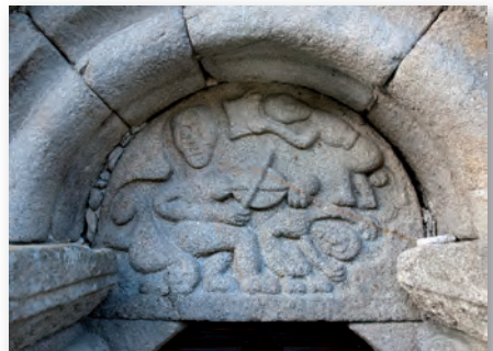
Escena xograresca no tímpano da igrexa de San Miguel do Monte, Chantada (ca. 1190)

A lírica trobadoresca é un fenómeno literario e musical, por iso as composicións se chaman cantigas . As cantigas podían ser amorosas ou satíricas. As amorosas son de dous tipos: de amor, imitación dos modelos occitanos, nas que canta a voz do poeta; ou de amigo, elaboradas a partir dunha tradición popular galega, nas que canta a voz da moza namorada (a amiga). Entre as cantigas de amigo salientan as cantigas de