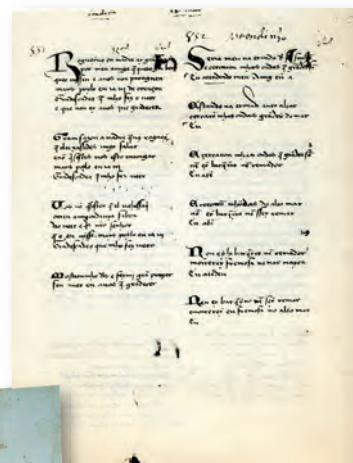
Cantiga de Meendiño do Cancioneiro da Biblioteca Nacional (Lisboa)

Entre os compositores de cantigas distínguense dous grupos: os trobadores e os xograres. Os primeiros eran señores que troban por pracer, os segundos plebeos que gañaban a vida como executantes. Os xograres foron especialistas na composición de cantigas de amigo e particularmente de cantigas de santuario. Entre eles, destacan dous nomes, os dous vencellados a Vigo e á súa ría: Martín Códax, cantor das ondas do mar de Vigo, e Meendiño, cantor da ermida de San Simón. Trátase de dous dos artistas de maior talento poético da lírica medieval galego-portuguesa, hispánica e europea.