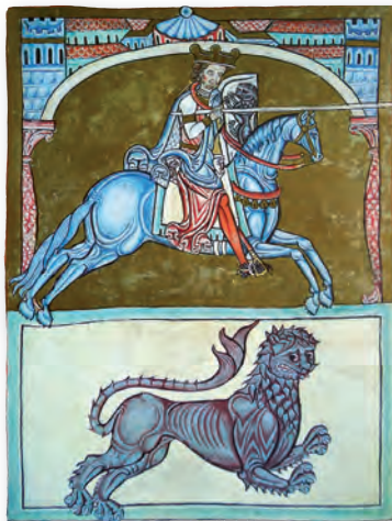
Afonso IX de Galicia e León. Catedral de Santiago de Compostela

Na Idade Media fórxase Galicia como país cunha cultura de seu expresada en galego. O Reino de Galicia estivo federado con León no século XII e no século XIII incorporouse á coroa de Castela. No marco do Reino de Galicia sitúase a terra de Toroño, fronteiriza con Portugal. Portugal xurdiu como reino independente no século XII, pero compartiu lingua e cultura con Galicia ata a metade do século XIV. O galego-portugués, lingua nacida a ambas as beiras do río Miño, comezou a escribirse a finais do século XII e na segunda metade do século seguinte xeneralizouse o seu emprego.