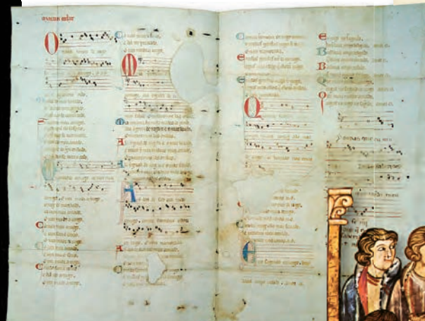
Pergamiño Vindel. Pierpont Morgan Library (Nova York)