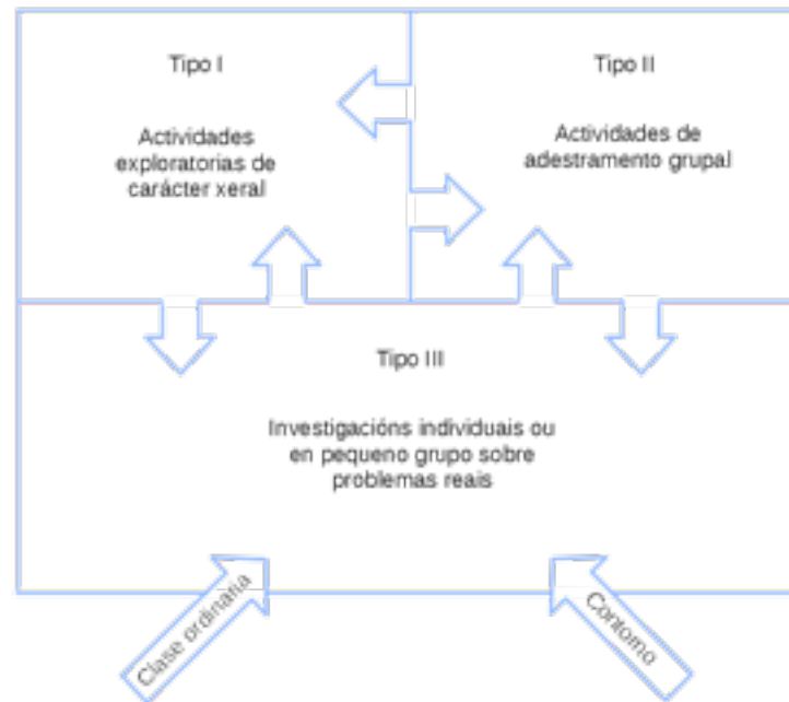
Figura III. O enriquecemento triádico

cooperación, o pensamento crítico e a creatividade tendo en conta os intereses do alumnado. A este respecto Renzulli (1976) establece tres tipos de enriquecemento curricular (figura III):