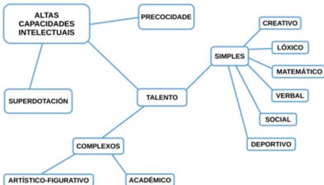
Figura I. Clasificación das altas capacidades intelectuais. Castelló e Batlle (1998)

Implica un perfil cognitivo superior e homoxéneo, cun elevado dominio en todas as áreas de coñecemento ou habilidades. No alumnado superdotado converxen un nivel intelectual elevado, unha alta creatividade e gran persistencia en determinadas tarefas.