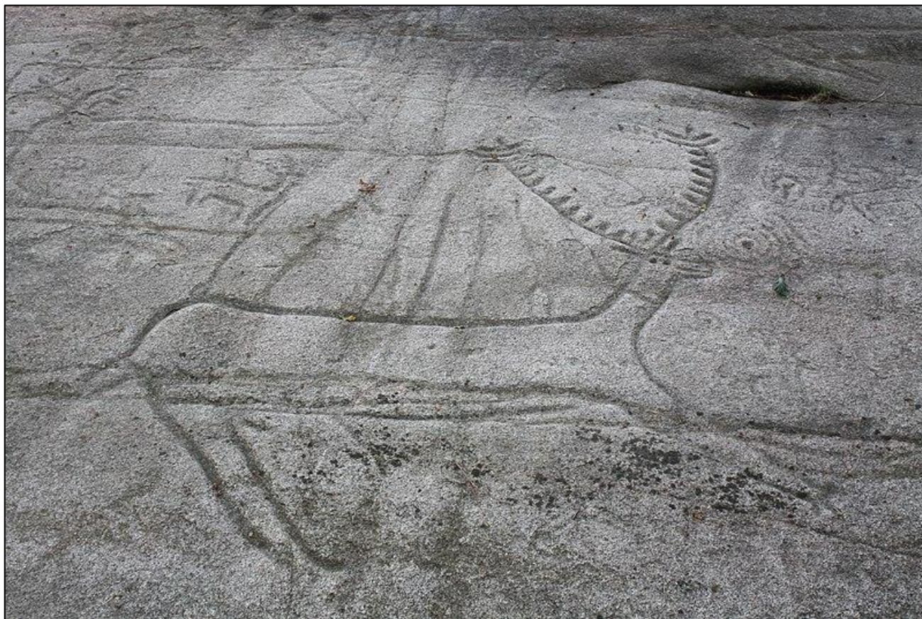
Ilustración 4. Petróglifo do gran cervo de Campo Lameiro

Centrado na arte rupestre, a xoia fundamental deste enclave é a increíble colección de petróglifos da Idade de Bronce. Conta con máis de oitenta gravados nunha superficie de máis de 20 hectáreas. Conta cun Centro de Interpretación cunha notable colección permanente e unha dinámica temporal tamén salientable. A construción dunha reprodución dunha aldea da época e a actividade de difusión sobre a vida prehistórica que realizan cos centros de ensino o converten nun dos máis visitados.