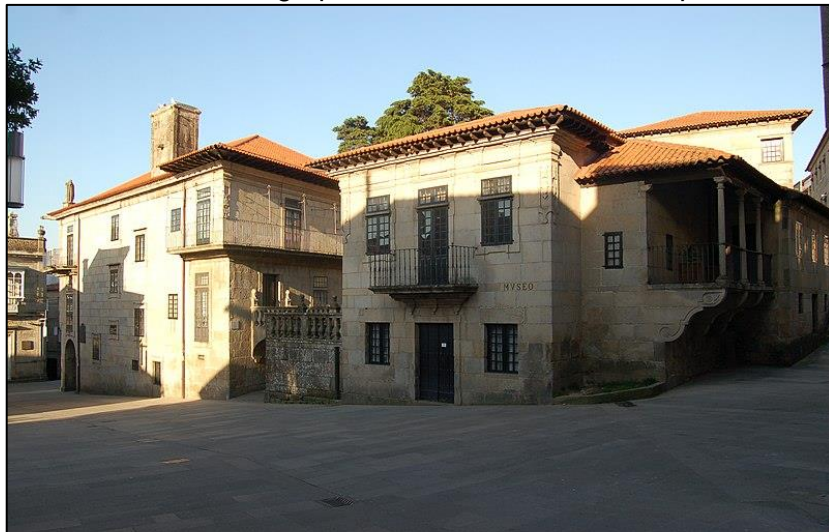
Ilustración 2. Museo de Pontevedra

O Camiño de Santiago practicamente caera no esquecemento a partir do s. XIX e foi clave para a