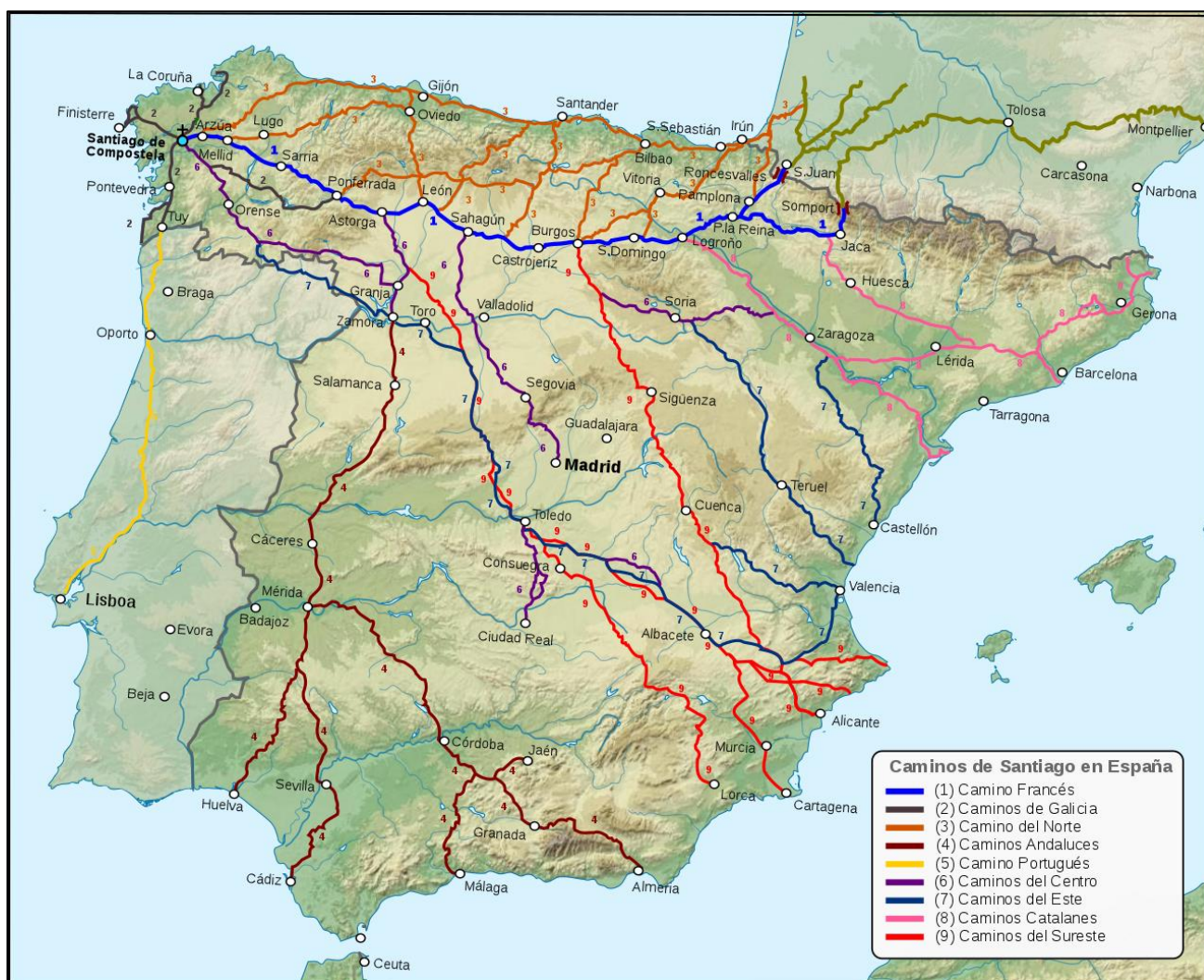
Ilustración 1. Os Camiños de Santiago en España

A rede de itinerarios integradas polas vías empregadas para peregrinar a Santiago de Compostela se denominan Camiños de Santiago . Isto débese para diferenciarse do Camiño de Santiago popularmente máis coñecido que é o Camiño Francés. Esta primeira ruta xacobeas gozou do apoio das institucións eclesiásticas, monárquicas e da nobreza e contará cunha primacía sobre as demais rutas xacobeas, xurdidas mesmo antes ca ela.