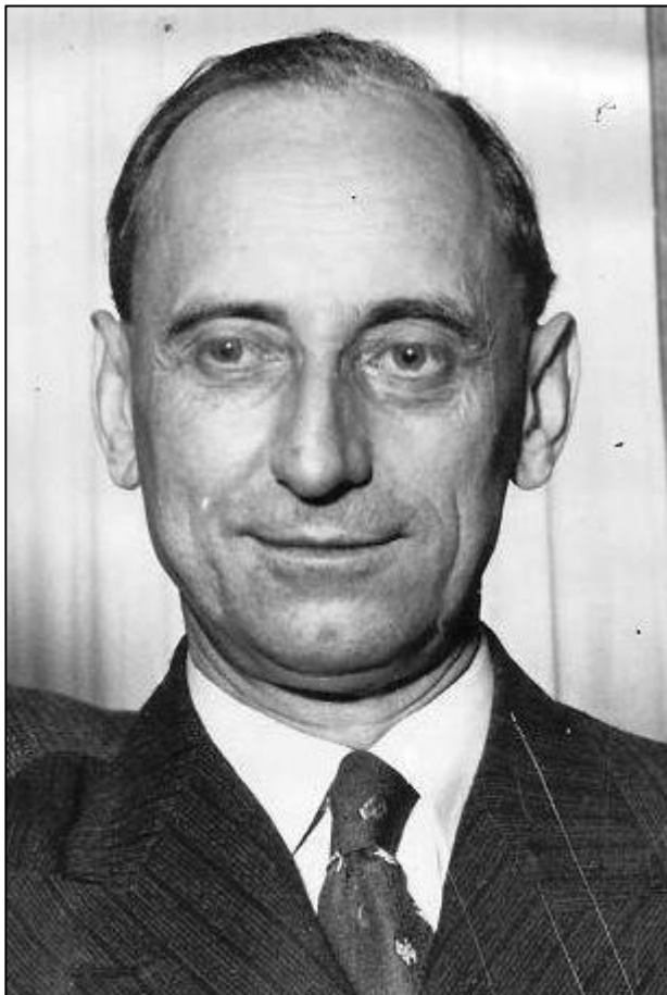
Ilustración 1. Santiago Casares Quiroga

en 1926. As discrepancias principais eran o excesivo centralismo, o abandono das clases populares e medias e o achegamento ás elites que propugnaba o sector de Alejandro Lerroux. Quedaba así dividido o republicanismo galego entre a ORGA, de Casares Quiroga, e Alianza Republicana, dirixida por Gerardo Abad Conde, e tendo como cidades principais A Coruña, con vínculos co movemento obreiro e colaboración con el, e Santiago.