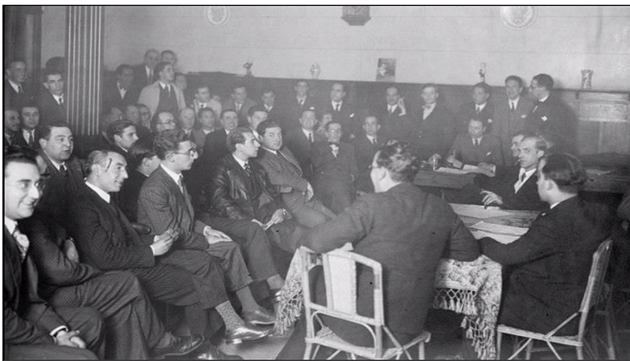
Ilustración 2. Fundación do Partido Galeguista en 1931

Formado en Pontevedra nunha reunión na que estiveron 80 representantes dos diferentes movementos nacionalistas de Galicia, e onde estiveron persoeiros como Castelao ou Otero Pedrayo que xa eran deputados en Cortes, na súa fundación redactouse un programa no que destacaban puntos como a concepción da nación como algo natural froito da historia, no sentido orgánico-historicista; a identificación da nación co rural (tendo unha idea pexorativa do espazo urbano como opresor do rural); a defensa da cooficialidade do galego co castelán ou o dereito de extinción e expropiación das rendas forais que quedaban.