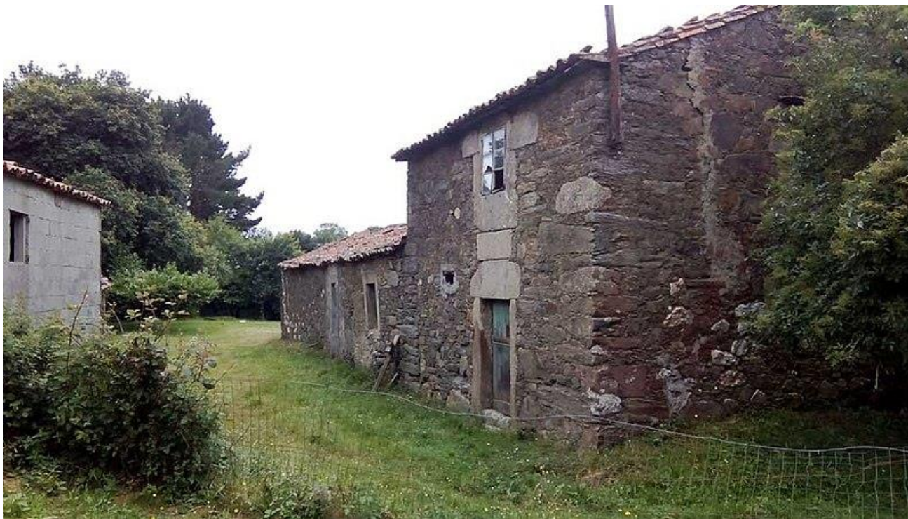
Ilustración 5. Casa de Foucellas en Mesía (A Coruña)