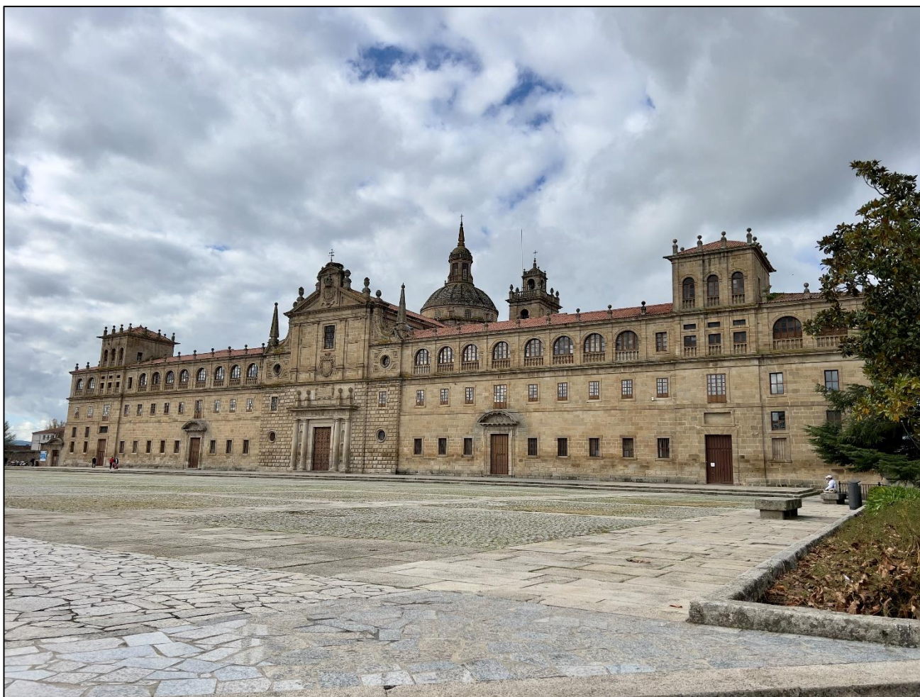
Ilustración 2. Colexio da Nosa Señora da Antiga de Monforte

xeométrico, a relación matemática entre os distintos elementos arquitectónicos, os volumes limpos, o predominio do muro sobre o van e pola ausencia case total de decoración.