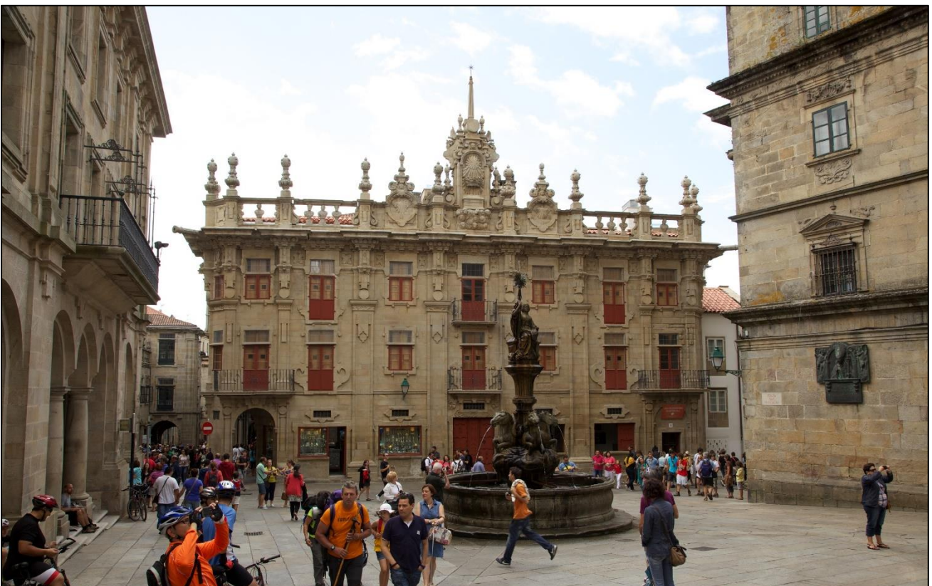
Ilustración 6. Casa do Cabido

Proxectada polo arquitecto do barroco galego Clemente Fernández Sarela, data do ano 1758. A Casa do Cabido é un edificio construído no século XVIII e concibido para o embelecemento urbano con obxecto de adornar a Praza de Praterías. É un dos mellores exemplos da función escenografía da