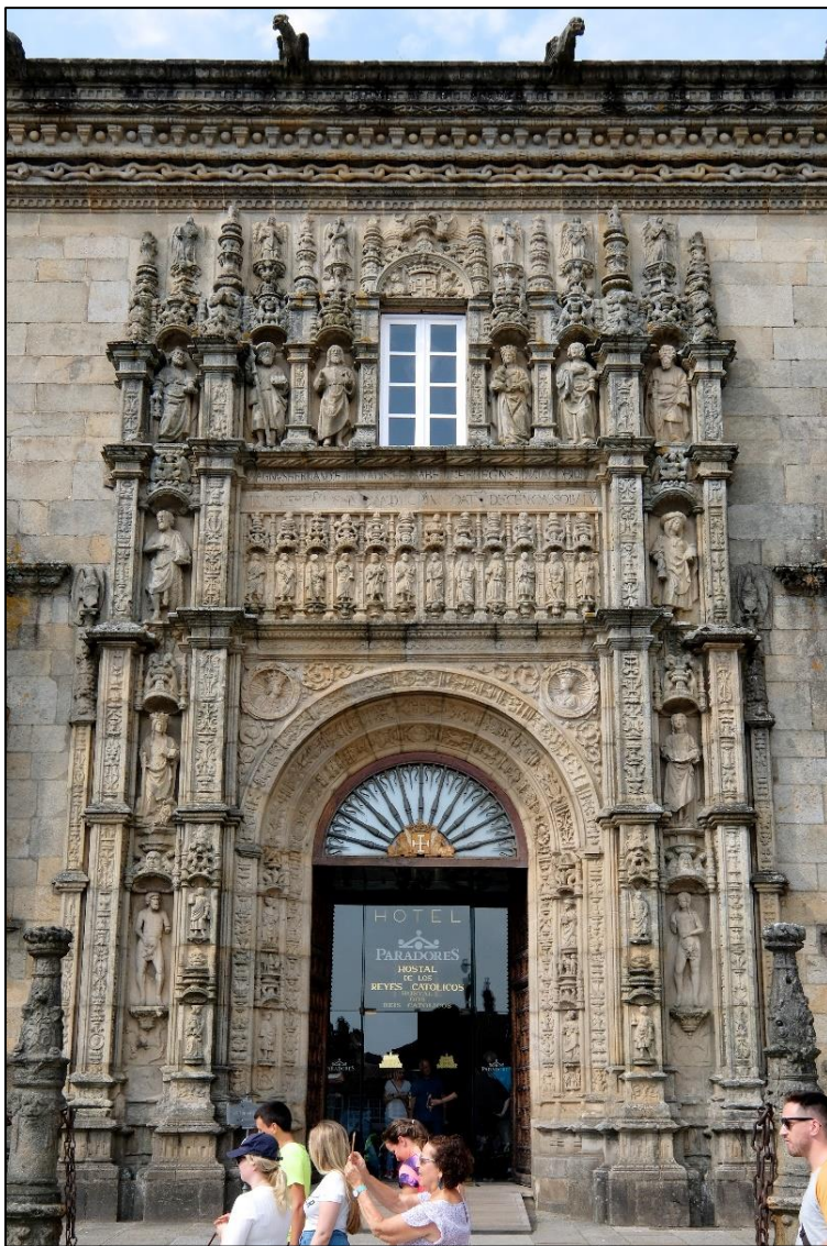
Ilustración 1. Hospital Real de Santiago

O Renacemento é un movemento cultural que aparece en Italia no século XV, estendéndose polo resto de Europa no século seguinte. Os renacentistas pretenden facer renacer a arte e a cultura greco-romana e volver aos ideais de harmonía e equilibrio do mundo clásico . Fronte ao teocentrismo medieval (Deus é o primeiro), o Humanismo pon en primeiro lugar ao home (antropocentrismo).