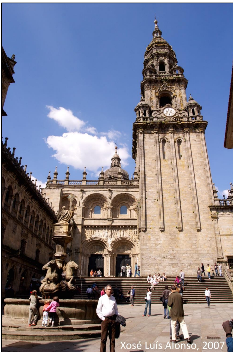
Ilustración 5. Torre Berenguela vista desde Praterías

Realizada baixo a dirección de Domingo de Andrade , coñécese tamén como a torre Berenguela. Unha vez que marcha Vega e Verdugo de Compostela deixou implantado un novo gusto e unha nova xeración de arquitectos entre os que destaca Andrade, nacido en Cee en 1639, arquitecto erudito de formación retablística.