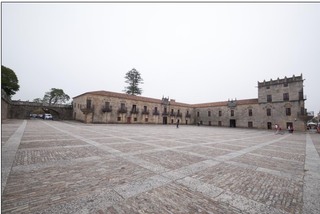
Ilustración 7. Pazo de Fefiñáns

En canto á arquitectura civil o máis salientable en Galicia son os pazos, edificacións que mostraban o prestixio da nobreza e, especialmente, da fidalguía galega. Os pazos de Fefiñáns, de Oca e de Santa Cruz de Ribadulla son dos mellores expoñentes.