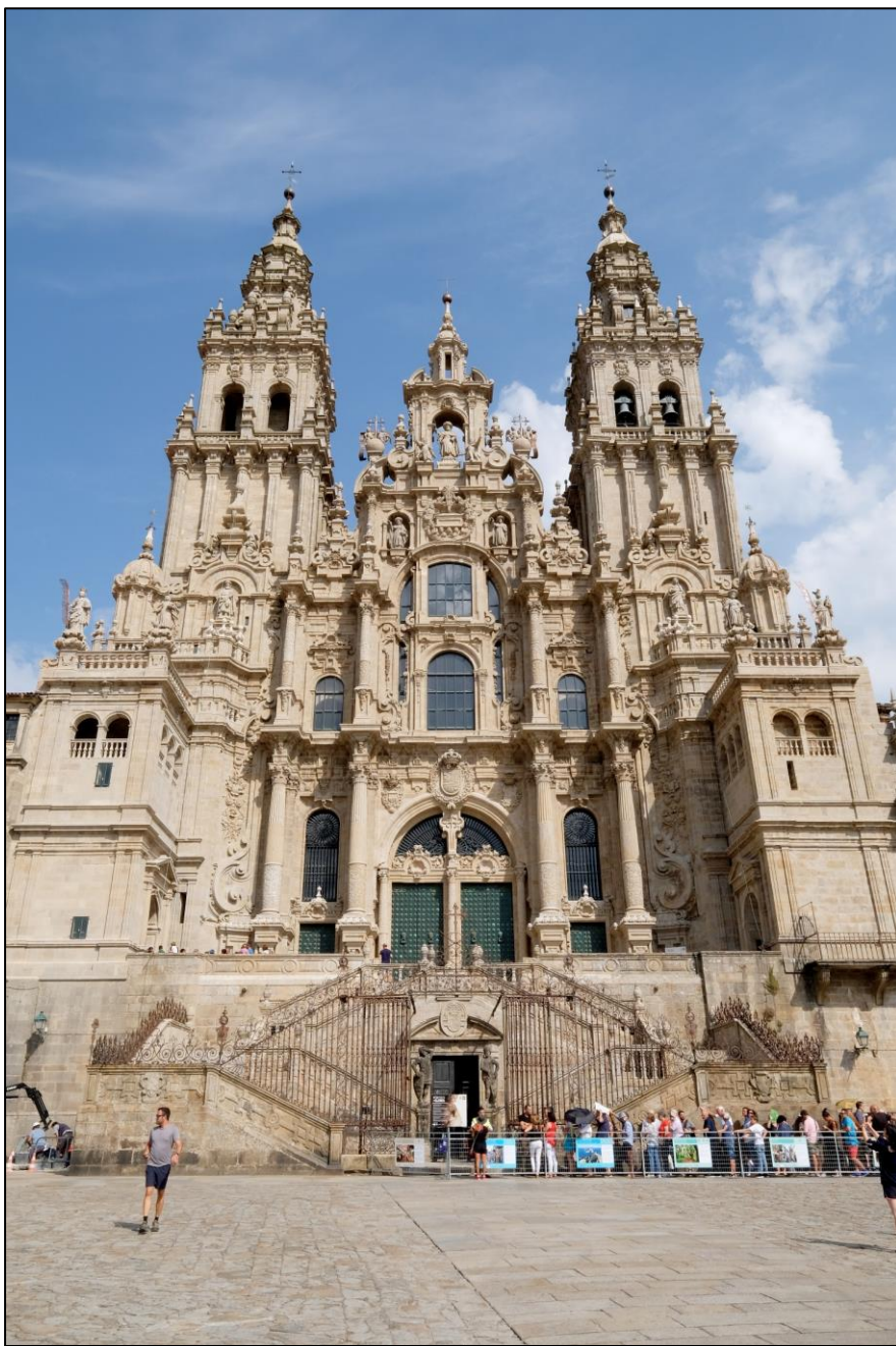
Ilustración 4. Fachada do Obradoiro

A partir de metade do século XVII o Barroco, vai supor un dos momentos de maior esplendor da arte galega, sobre todo en arquitectura. Galicia vive nestes momentos unha febre de transformacións arquitectónicas e urbanas que curiosamente coinciden cun período de estancamento económico. Os únicos que gozan de enormes beneficios son os membros do clero (favorecidos polo sistema de arrendamentos en foros) e esta situación económica favorecerá que acometan obras de remodelación de vellas construcións ou creación de outras novas. É destacable o papel do Cabido de Santiago de Compostela.