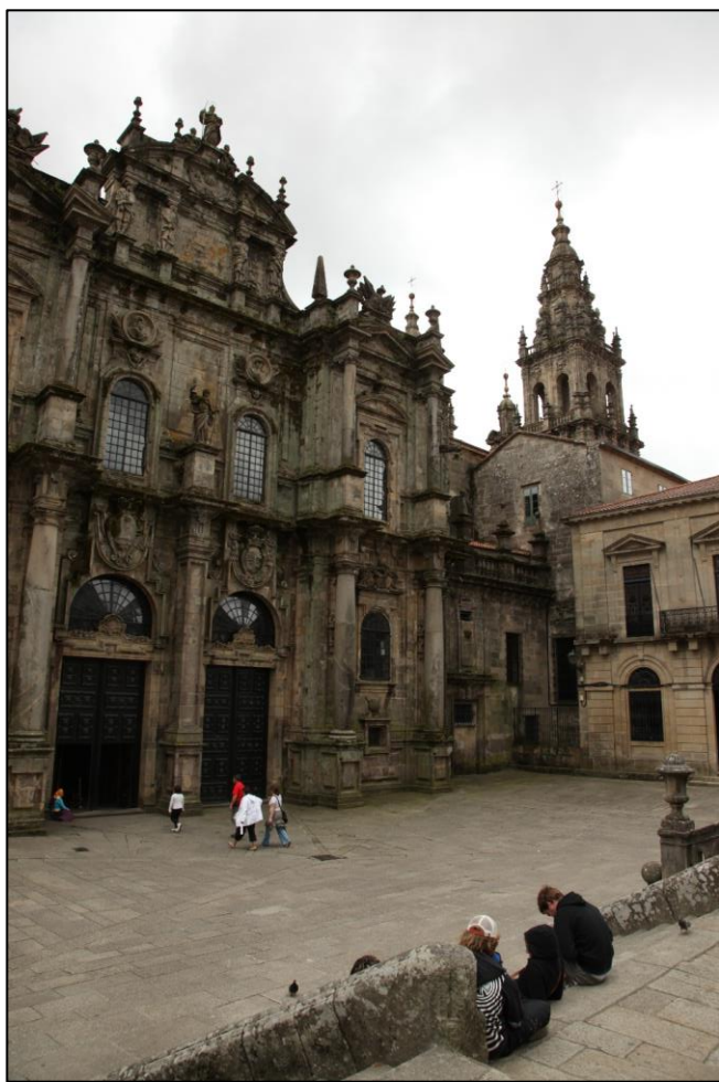
Ilustración 9. Fachada de Acibecharía

O neoclasicismo español bebe das fontes do neoclasicismo francés, que, a diferenza doutros lugares europeos, escolle mirarse na tradición romana en troques da grega. No caso de Galicia temos varios exemplos significativos.