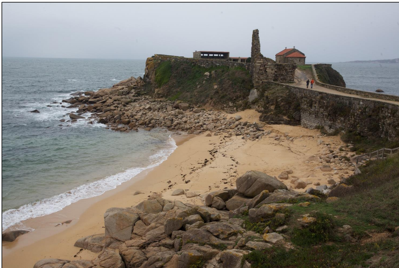
Ilustración 8. Vista da fortaleza da Lanzada destruída nas guerras irmandiñas

A nobreza galega estaba descontrolada. En 1429 morre o último representante da gran nobreza radicada en Galicia e vinculada coa familia real: Don Fadrique. É unha nobreza sen liderado interno e cada unha das familias aristocráticas loita na comarca ou comarcas en que están asentadas, para incrementar ou seu poder. Outra cuestión importante é a escasa presenza real en Galicia, que xa vén de atrás. A ausencia prolóngase entre 1376 e 1486, cando veñen os Reis Católicos. Tamén é importante a perda de funcionalidade dos Adiantados Maiores, os grandes representantes do poder rexio.