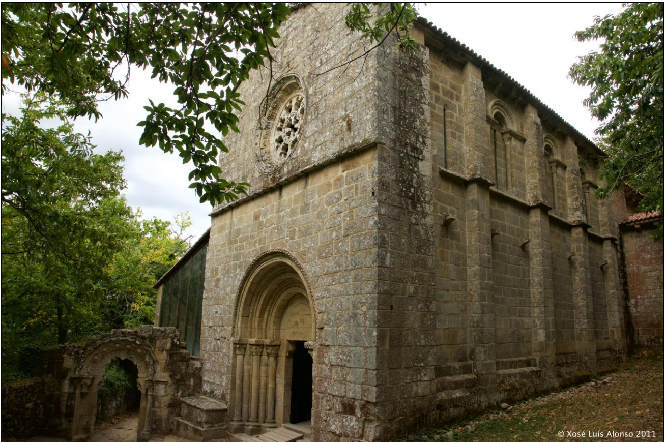
Ilustración 3. Santa Crsitina de Ribas de Sil

Mención aparte son os señoríos eclesiásticos , que pola extensión dos seus dominios e das súas rendas foron o grupo máis importante dos privilexiados na sociedade galega medieval. Os mosteiros do Císter e dos Bieitos acumularon enorme poder patrimonial froito de doazóns dos monarcas e dos fieis. Estas terras eran administradas mediante explotación directa ou indirectamente a través do arrendamento e dos foros a partir do s. XII. Cabe destacar coma exemplos destes mosteiros os emprazados na Ribeira Sacra que podemos catalogalos coma un dos máximos expoñentes do estilo románico en canto aos mosteiros. Os controlados polos bieitos de Santo Esteban de Rivas de Sil e o de Santa Cristina de Ribas de Sil , e, o mosteiro feminino do Císter de Santa María de Ferreira de Pantón .