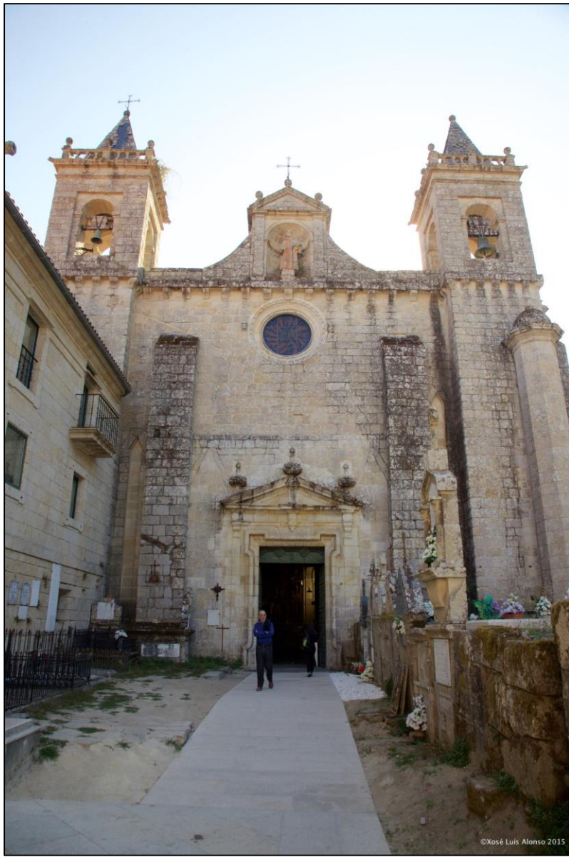
Ilustración 2. Santo Estevo de Rivas de Sil

A célula básica na ordenación do territorio e no asentamento humano é a vila . Vila non entendida xa coma as villae de época romana senón máis ben coma as aldeas. Existe unha tremenda coincidencia entre as vilas medievais documentadas e a vilas actuais. O modelo agrícola vixente na Galicia do