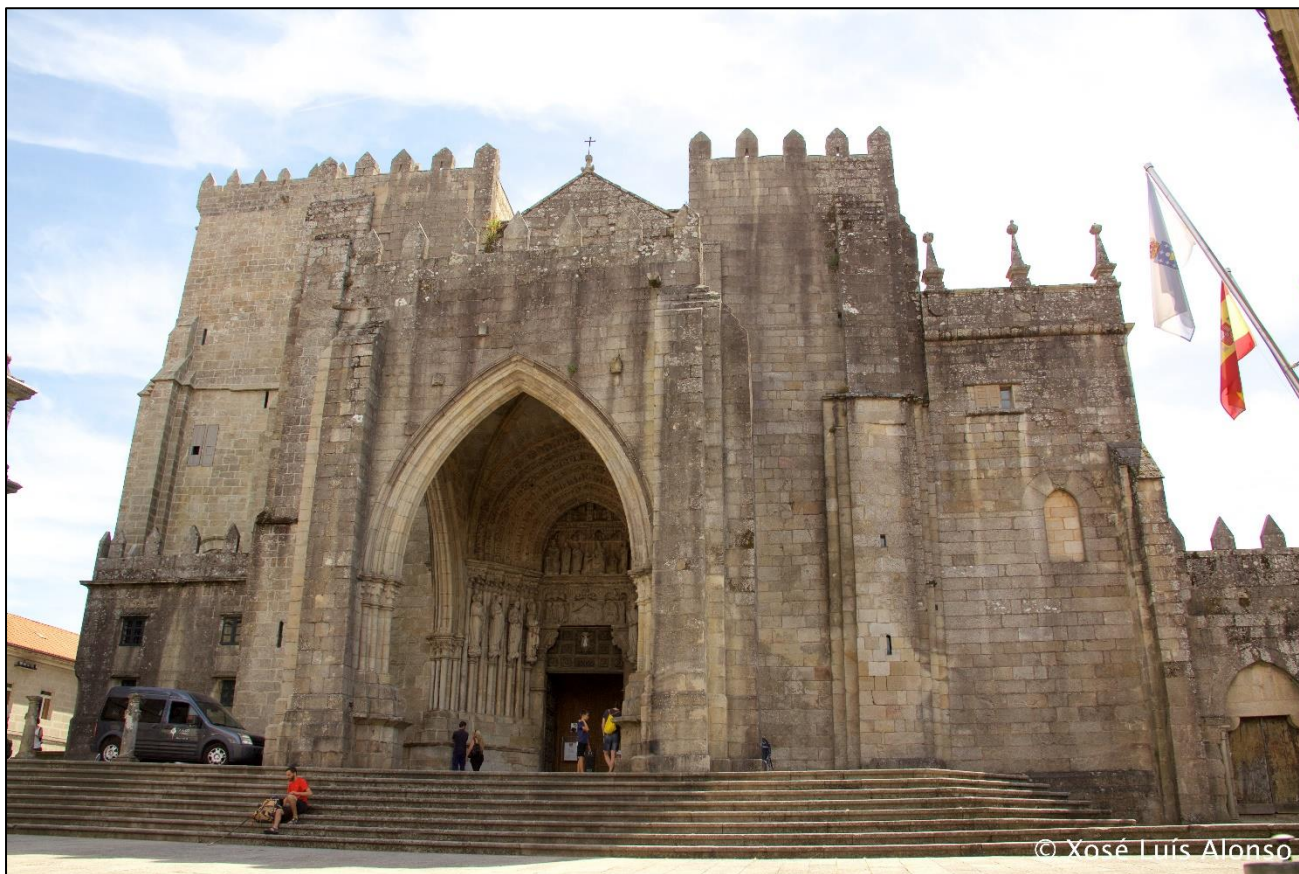
Ilustración 7. Catedral-fortaleza de Tui

En Galicia, a peste penetra polo porto de Baiona e chega ao mesmo no 1348. Esta epidemia deixou despoboados moitos pobos e aldeas co conseguinte abandono de moitos campos por falta de man de obra. Os campesiños foron os máis afectados, tiveron serios problemas para poder seguir cumprindo coas súas obrigas forais, e os señores viron como as súas rendas diminuíron notablemente. Esta situación derivará nunha potente crise social que puxo a proba o sistema estamental; xa que, a necesidade da nobreza de reter aos campesiños nos seus señoríos e o descenso das rendas obtidas debido a crise global, fixeron máis duras as relacións feudais.