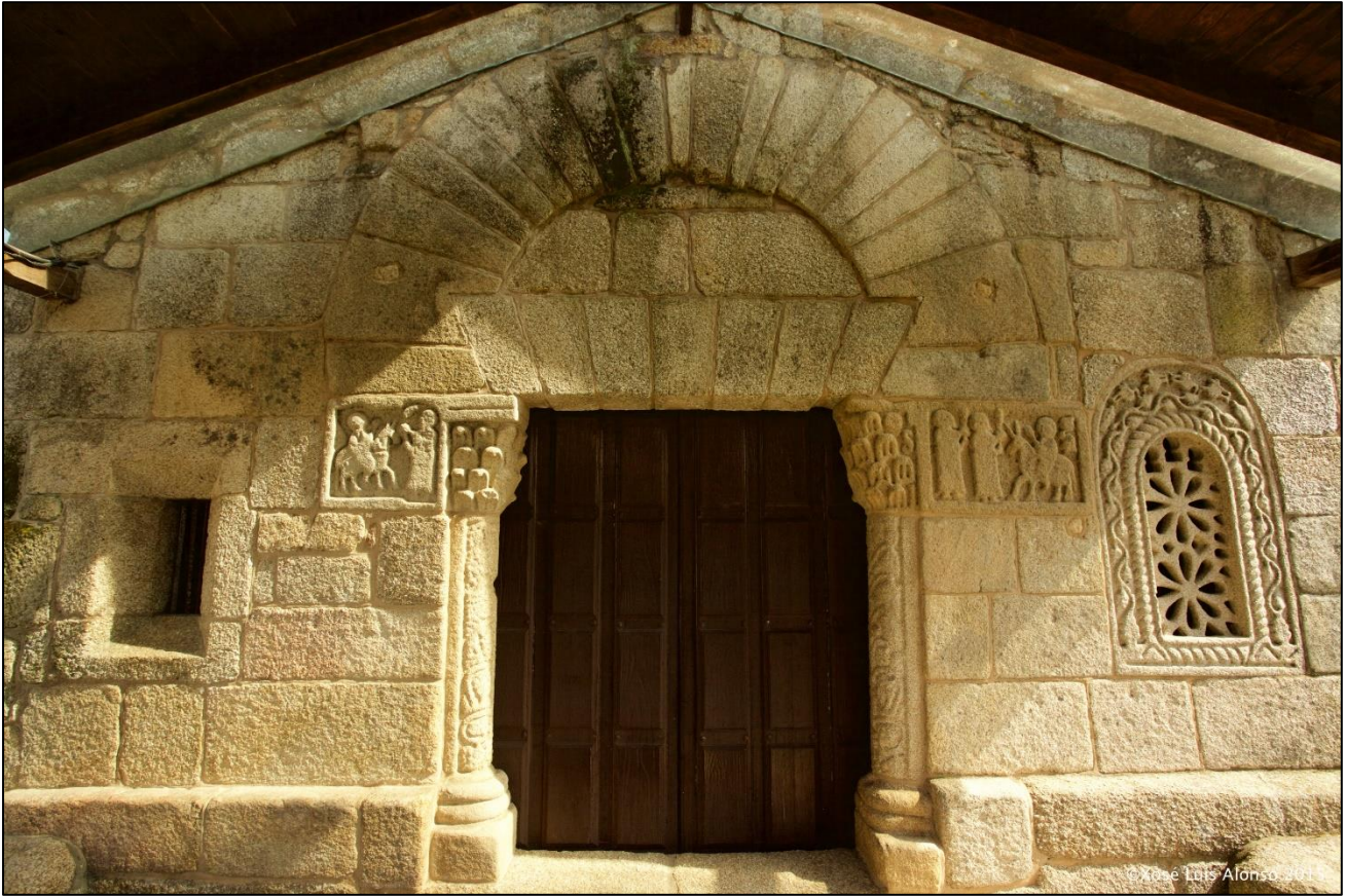
Ilustración 1. Capela visigótica de San Xes de Francelos

No século VIII, baixo a figura de San Frutuoso de Braga e da Regula Monastica Communis comeza o monacato galego e a fundación de mosteiros que estaban federados, e incluso algúns deles eran organizacións familiares (familias que se retiraban a vivir nos mosteiros mesturando a vida familiar coa vida relixiosa). Era un modelo distinto ao dos bieitos que se imporá máis adiante. A regra de Frutuoso era tremendamente rigorista, moi disciplinaria e con sistemas de comida e vixilia absolutamente espartanos. Desta época datan a fundación dos mosteiros de San Xulián de Samos ou o de San Pedro de Rochas, un dos máis significativos eremitorios galegos.