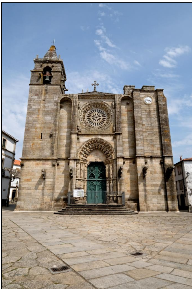
Ilustración 5. San Martiño de Noia

O mar é o principal espazo do proceso de urbanización nesta época. Deixa de ser visto e considerado como un elemento perigoso, o cal ten que ver coa desaparición da pirataría normanda (século XI), e da pirataría sarracena (XII). A revitalización do comercio por vía marítima , que comeza a partir do XII, e o lugar estratéxico que ocupa Galicia nos contactos entre o Mediterráneo e o Atlántico, fai do control da costa unha cuestión moi importante para as institucións señoriais e para a monarquía. Moitas das cidades fundadas polos monarcas quedarían doadas ao arcebispo de Santiago, quedando finalmente só como cidades de reguengo (baixo control directo do monarca) as cidades de Baiona, A Coruña e Ribadeo.