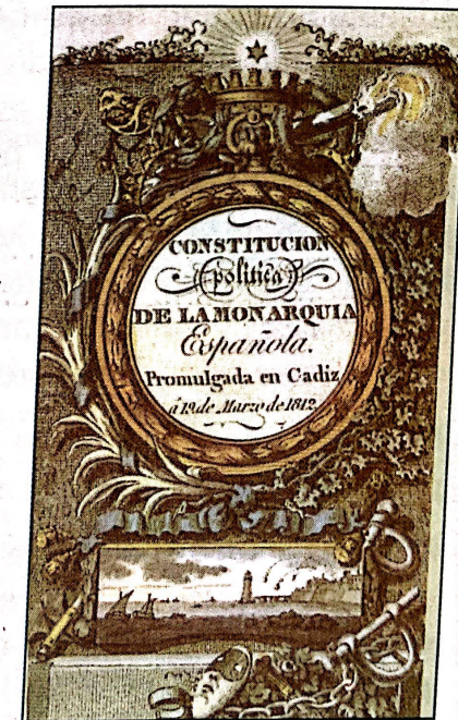
A Constitución de 1812.