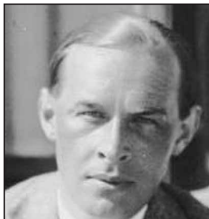
Erich Maria Remarque (1898-1970, Osnabrück)