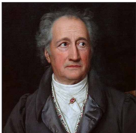
Johann Wolfgang von Goethe (1749-1832, Frankfurt)

Velaquí os autores das obras representadas: