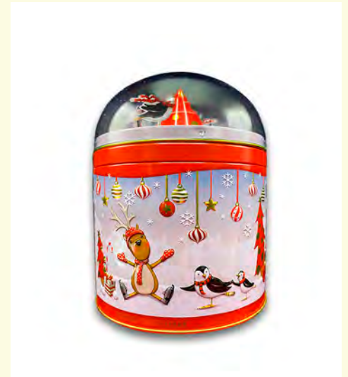
Lata metálica bola pingüino musical rellena de bombones praliné. 150gr.