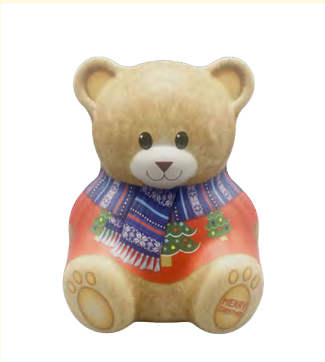
Lata osito de Navidad rellena de bombones praliné.150gr.