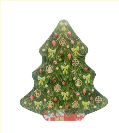
Lata de Abeto con motivos Navideños rellena de bombones praliné.150gr.