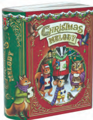
Lata metálica libro Melody rojo rellena de bombones praliné. 150gr.