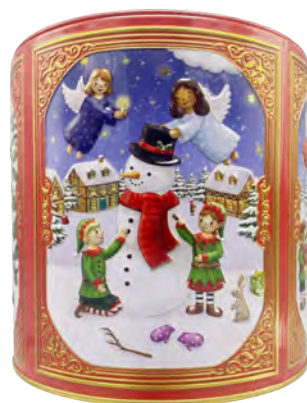
Lata redonda tambor Angeles y Gnomos con motivos navideños rellena de bombones praliné. 150gr.