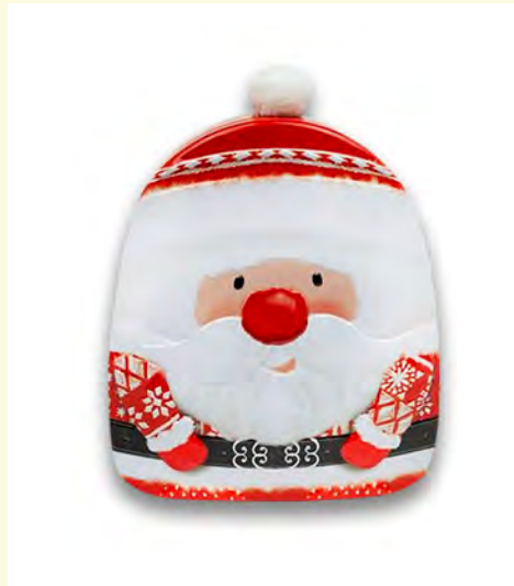
Lata metálica bobble hat Papa Noel rellena de bombones praliné. 150gr.