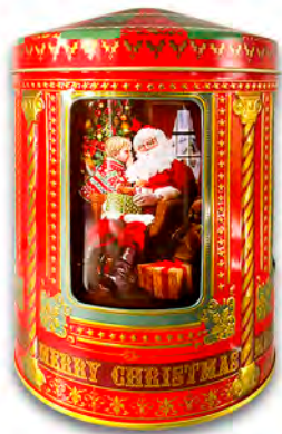
Lata metálica carrusel musical santa rellena de bombones praliné. 150 gr.