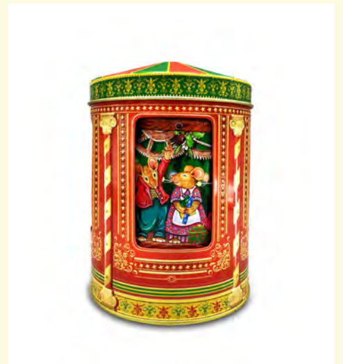
Lata metálica carrusel musical ratoncitos rellena de bombones praliné. 150 gr.