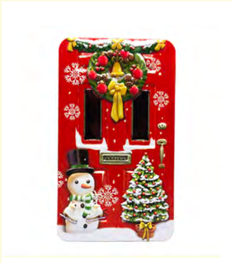
Lata metálica puerta Navideña rellena de bombones praliné. 150 gr.