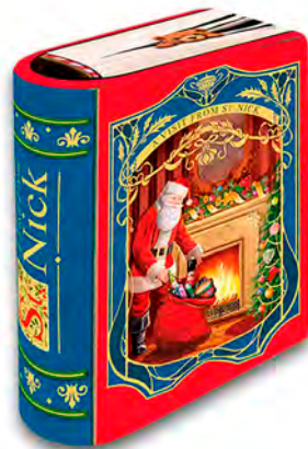
Lata metálica libro San Nicolas rellena con bombones praliné. 150 gr.