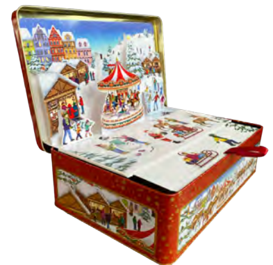
Lata pop-up 3 dimensiones rellena de bombones praliné. 450gr.