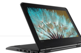
Lenovo Yoga 11e 5th Gen