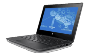
HP ProBook x360 11 G5 EE