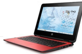
HP ProBook x360 11 G1 EE

No fogar, o/a alumno/a pode conectar o equipo a unha rede WIFI, igual que calquera outro dos seus propios dispositivos persoais.