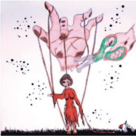
I. E. S. Llanes, I°

de “las mujeres que venden su cuerpo” y el resto de definiciones. Partiendo de la reflexión de la información compartida se pretende generar un pequeño debate respecto al tema de la responsabilidad y las medidas que todos/as podemos tomar frente a esta problemática.