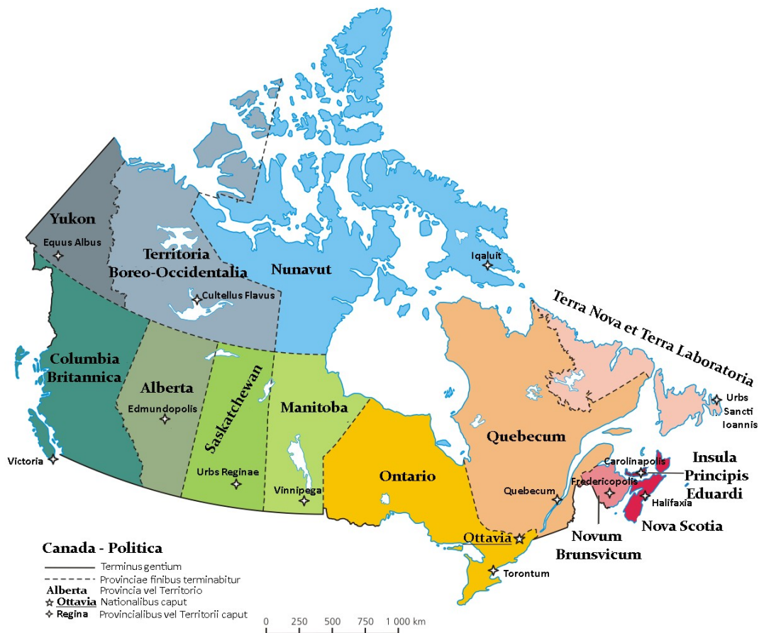
Fig. 1: Provincias e Territorios de Canadá

Con 2,6 millóns de habitantes, Toronto é a cidade máis grande de Canadá e a capital da provincia de Ontario. Toronto é cosmopolita e internacional, o que a converte nunha das cidades máis diversas país. Tamén é a capital comercial de Canadá e un dos centros financeiros do mundo. Encóntrase a pouca distancia das fervezas do Niágara.