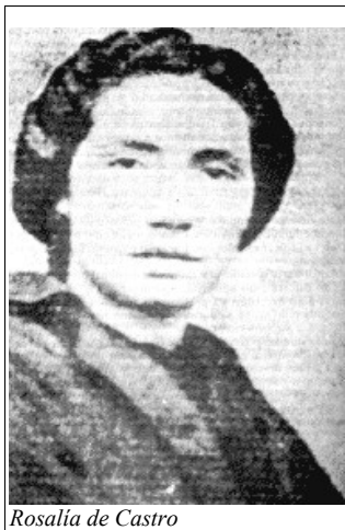
Rosalía de Castro