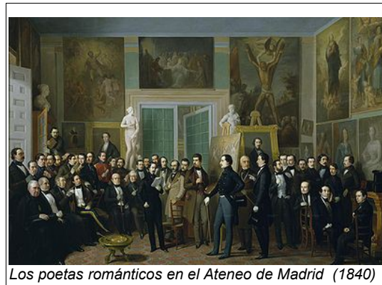
Los poetas románticos en el Ateneo de Madrid (1840)