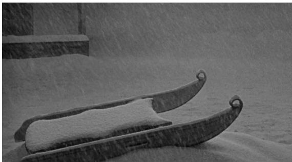
A zorra "Rosebud", un motivo esencial en Citizen Kane (1941)

“Aparello de transporte tradicional, máis rudimentario e primitivo que o carro”, mais tamén ese caixón que empregamos para escorregar pola neve.