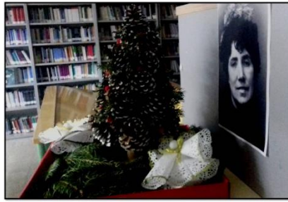
FELICES FESTAS E UN LECTOR ANO 2024!