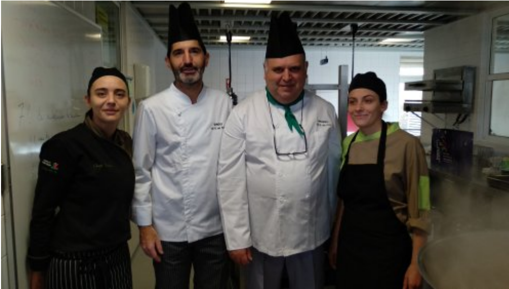
Foto. En Viana do Castelo con las profesoras de cocina

Las actividades se han ajustado a la programación del viaje