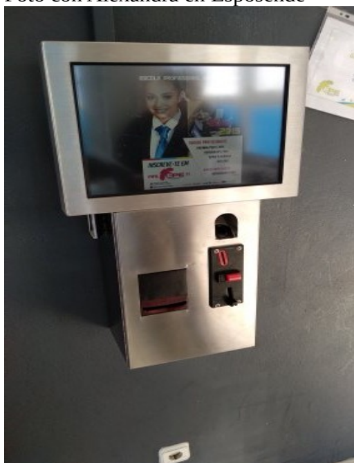
Foto de la máquina para hacer los pedidos y pagar en el bar