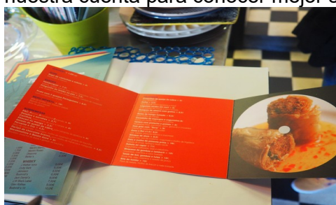
Foto de la carta

Con el mismo gestor visitamos un segundo restaurante de la misma propiedad, llamado Casa de pasto con una carta en forma de caja de CD con sus mejores platos desde su apertura. Nos muestran la cocina y nos explican la filosofía del establecimiento, en este vendríamos a cenar por nuestra cuenta para conocer mejor sus platos.