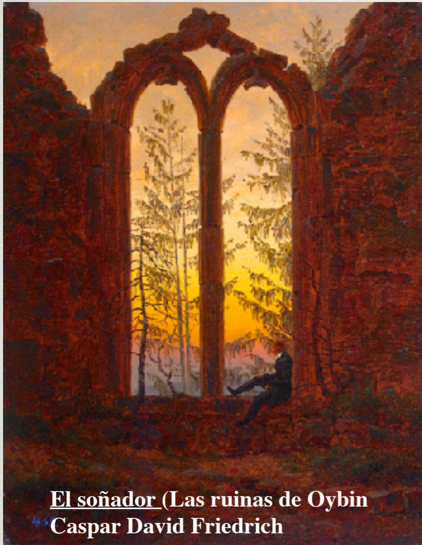
El soñador (Las ruinas de Oybin) Caspar David Friedrich