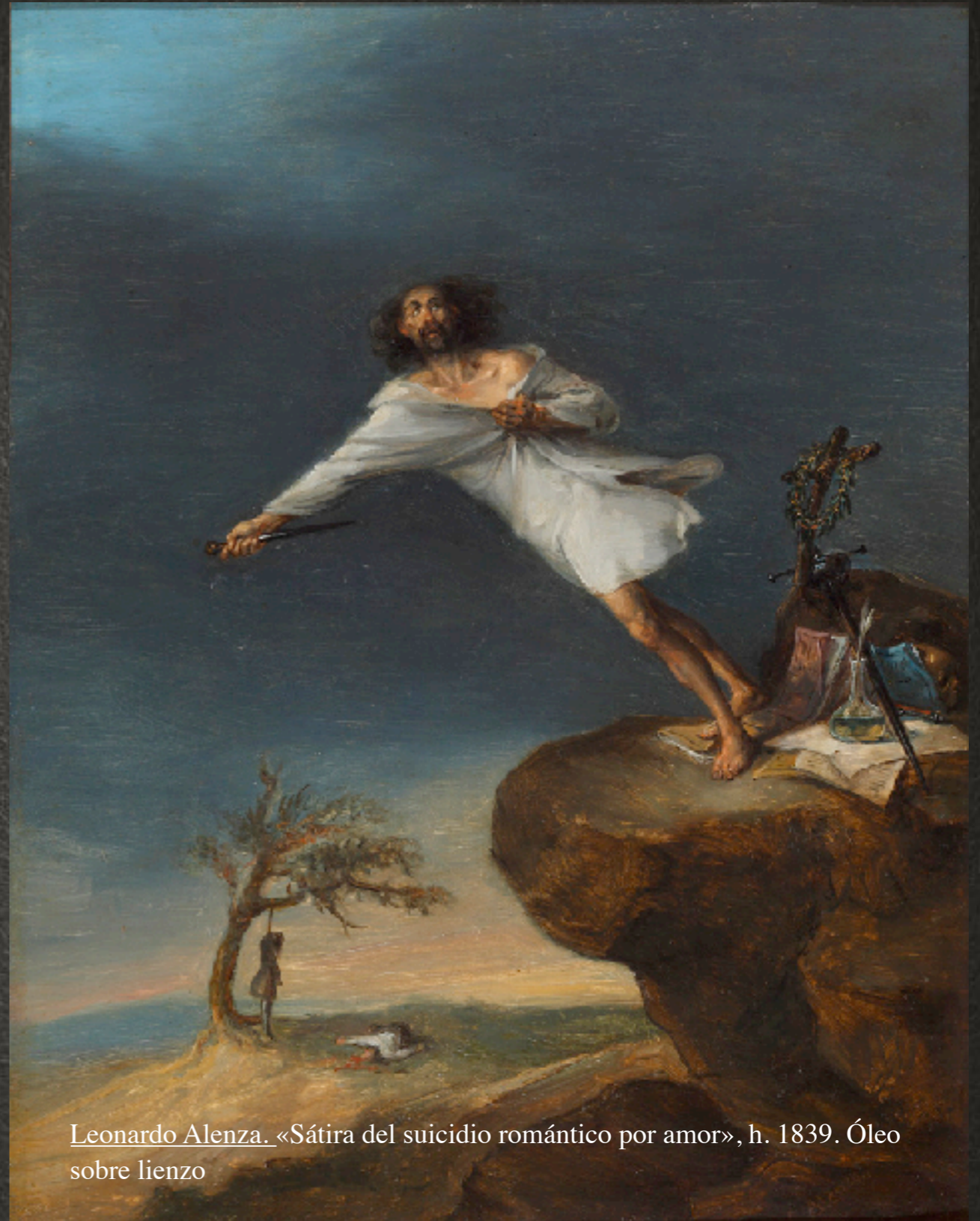
Leonardo Alenza . «Sátira del suicidio romántico por amor», h. 1839. Óleo sobre lienzo