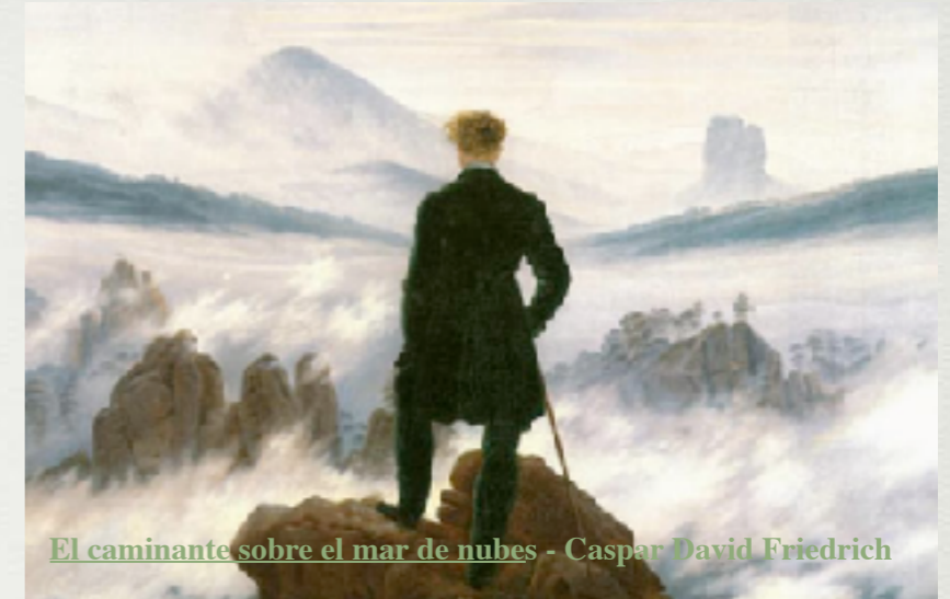
El caminante sobre el mar de nubes - Caspar David Friedrich