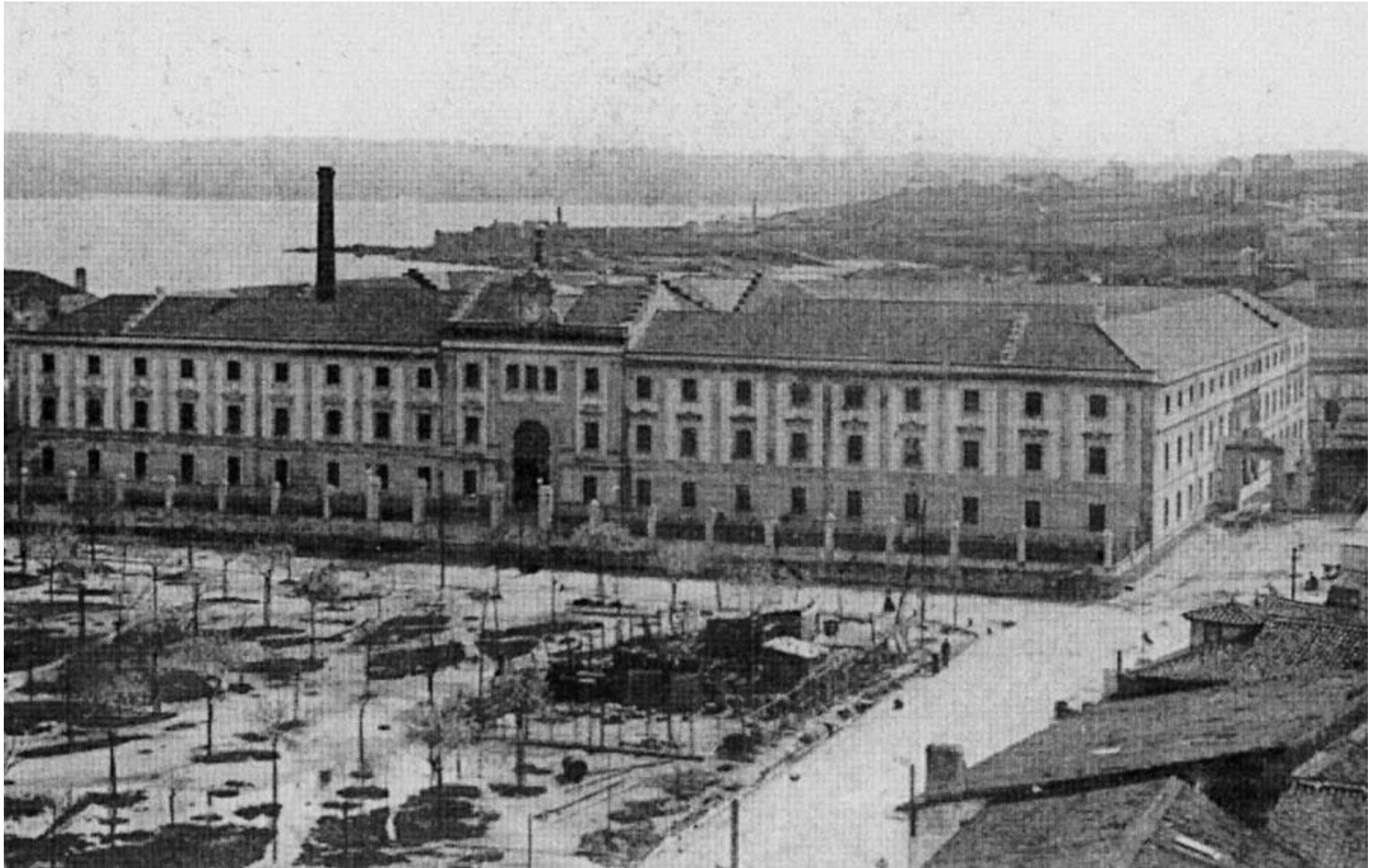
Na Fábrica de Tabacos da Coruña traballaron ao redor de 3000 mulleres