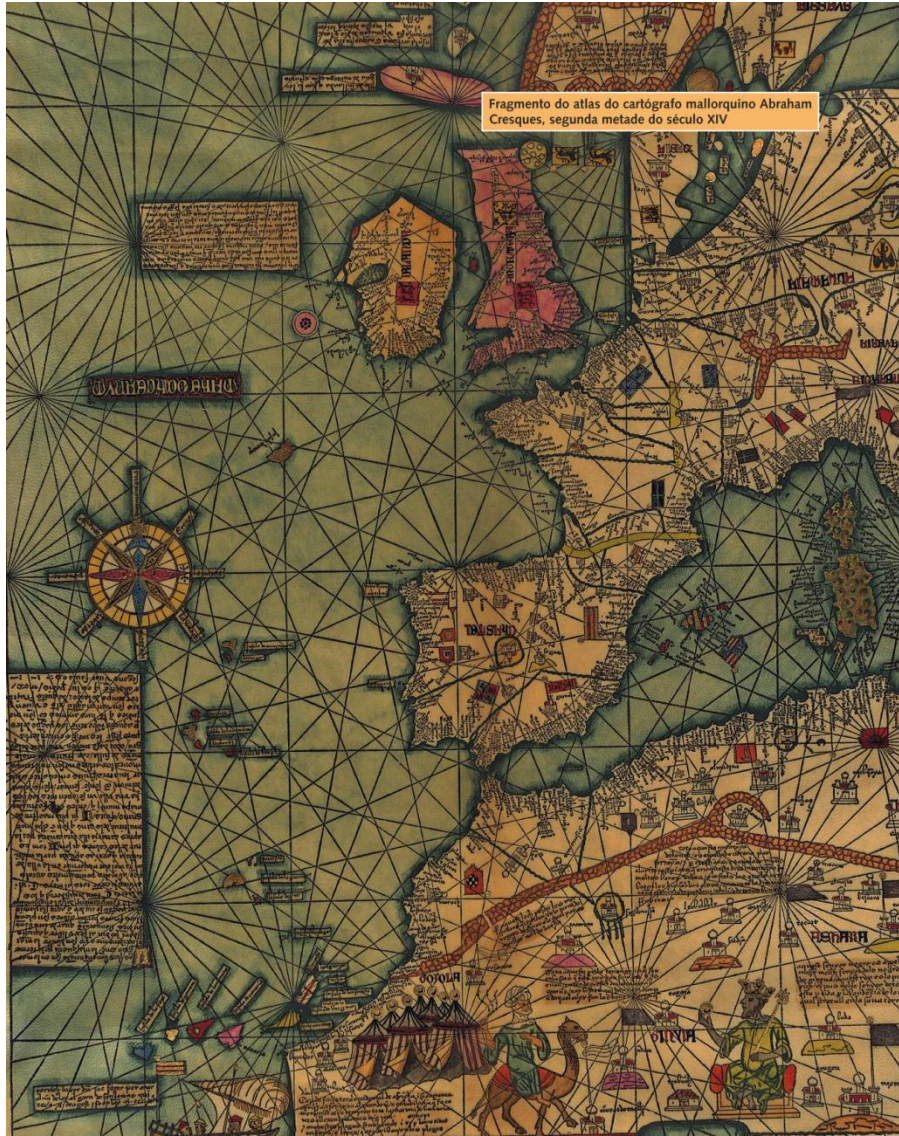
Fragmento do atlas do cartógrafo mallorquino Abraham Cresques, segunda metade do século XIV