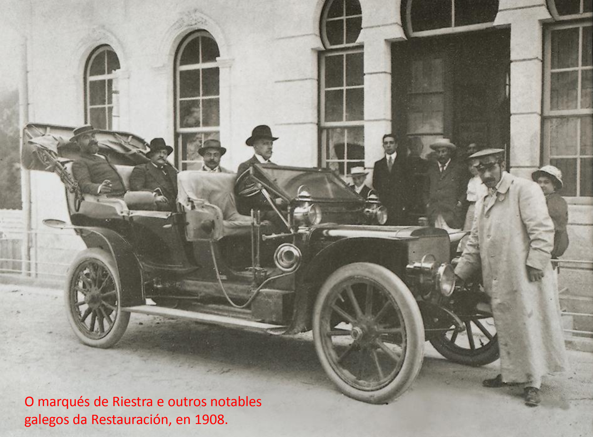
O marqués de Riestra e outros notables galegos da Restauración, en 1908.