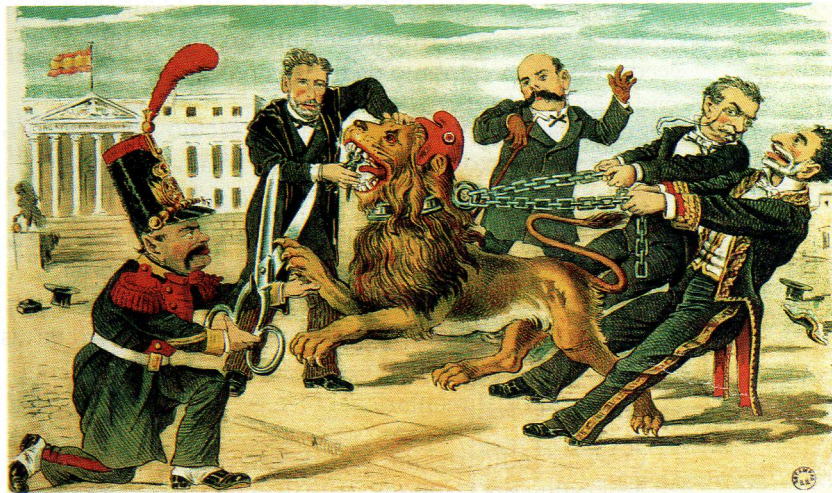
UÑA POR UÑA E DENTE POR DENTE. OS POLÍTICOS SUXEITAN Á «REPÚBLICA», 1881

Debido a que esta práctica electoral marxinaba do exercicio do poder a numerosos partidos políticos (republicanos, socialistas e nacionalistas) que cada vez representaban a sectores máis amplos da sociedade, o sistema político da Restauración acabaría entrando nunha profunda crise .