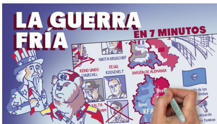
Vídeo de EducaPlay sobre a Guerra Fría