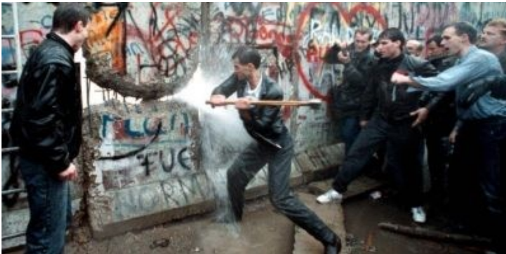
Vídeo explicativo da BBC sobre a orixe e o final do Muro de Berlín (Ctrl + Clic)