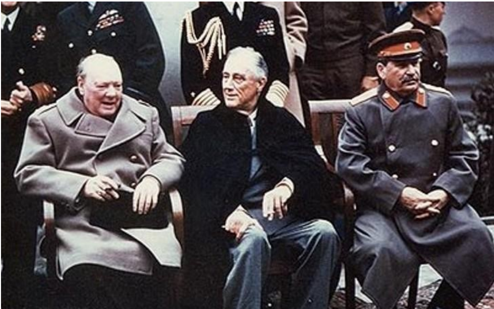
Churchill (UK), Roosevelt (EEUU) e Stalin (URSS) na Conferencia de Ialta (1945).