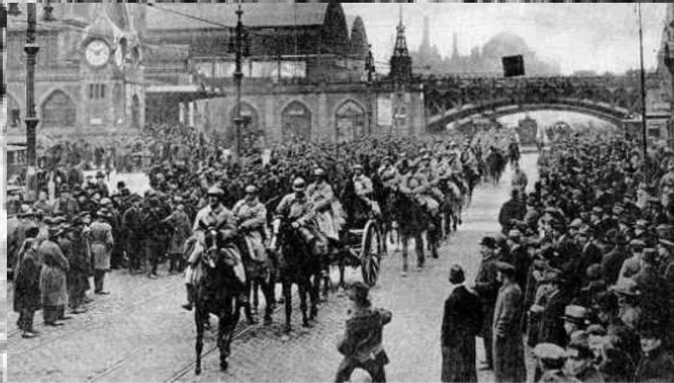
Invasión francesa del Ruhr, enero de 1922.

- As tensións entre Francia e Alemaña que provocaron a invasión francesa do Ruhr (1922) co obxecto de cobrar as débedas en forma de carbón e aceiro.