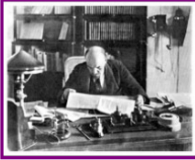
Lenin, na súa oficina do Kremlin, 1918

Baixo o liderado indiscutible de Lenin, as ideas de partido dos bolxeviques eran: