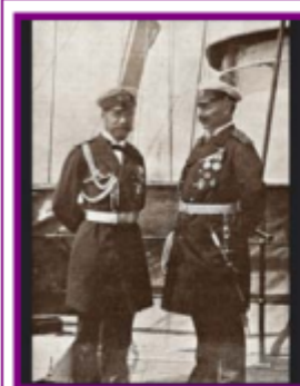
3 de agosto de 1917. O tsar Nicolás II e o káiser Wilhelm II en Alemaña. Eran primos. O káiser tamén era primo do rei Xurxo V de Gran Bretaña.

O sistema político é a autocracia tsarista. O poder ocupábo o tsar Nicolás II , da dinastía Romanov, home de personalidade débil. Para facilitar o dominio sobre un país tan grande e cun sistema social tan inxusto, a relixión cristiá ortodoxa predicaba a submisión ao tsar e a resignación.