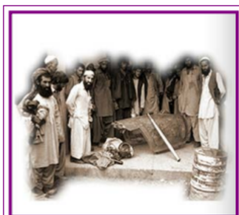
Guerrilleiros islamitas (Muxahidin) mostran restos dun avión soviético derrubado en 1984.

Este país empobrecido estaba sumido no caos e Moscova decidiu intervir para impoñer un goberno que garantise a orde e mantivese o país na esfera de influencia soviética.