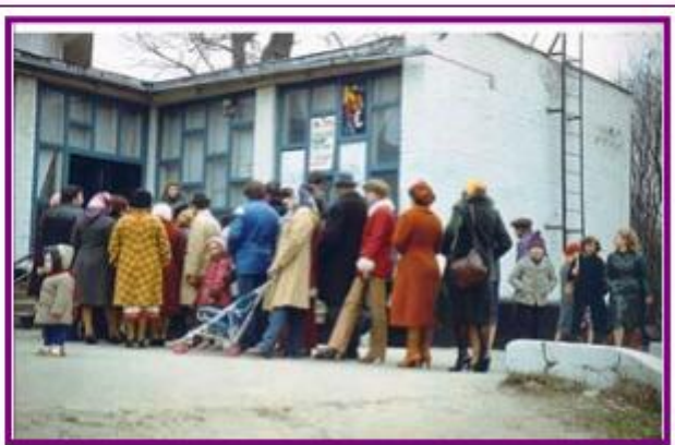
A ineficacia económica do sistema soviético reflectíase en continuas colas para acceder aos escasos bens de consumo dispoñibles. Kharkiv, 1981.

As dificultades económicas do mundo occidental tras a "crise do petróleo" de 1973 e a renitencia americana a implicarse militarmente no exterior tras o fracaso de Vietnam animaron a Moscova a intervir en diversas zonas do mundo. Foi unha miraxe. A debilidade norteamericana era aparente. A soviética era real. A súa economía entrara nun período de estancamento que finalmente