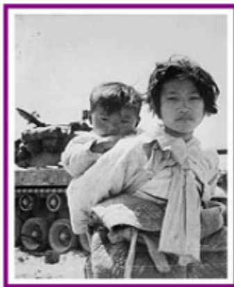
Dous irmáns ante un tanque M-26 en Haengju durante a guerra de Corea. 06/09/1951.

Tras a finalización da Segunda Guerra Mundial a península de Corea foi dividida en dúas zonas que tomaban como fronteira o paralelo 38°. Tras a derrota de Xapón, o norte da península fora ocupado por tropas rusas e o Sur, por tropas norteamericanas.