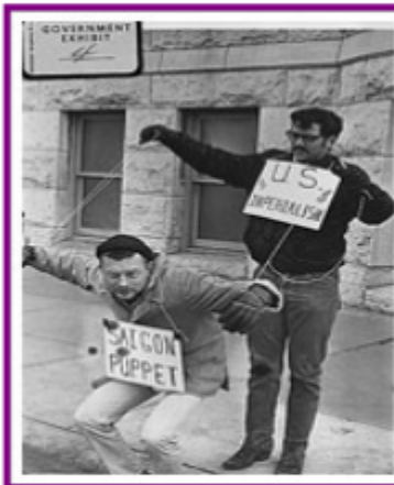
Protestas en Wichita contra a guerra de Vietnam 1967

Tras a división de Vietnam en dous estados, segundo o estipulado na Conferencia de Xenebra de 1954 e a evacuación de Francia, Ho Chi Minh, dirixente comunista norvietnamita, anunciaba a súa intención de enviar tropas a Vietnam do Sur onde se organizou a Fronte de Liberación Nacional a través da guerrilla revolucionaria ou brazo armado do Vietcong .