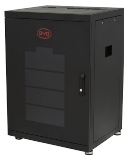
Battery-Box Pro 2.5-10.0