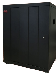
Battery-Box Pro 13.8