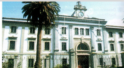
FÁBRICA DE TABACOS DE CORUÑA.

*Proba de acceso á Universidade (Comisión Interuniversitaria de Galicia), opción 2 de xuño de 2007.