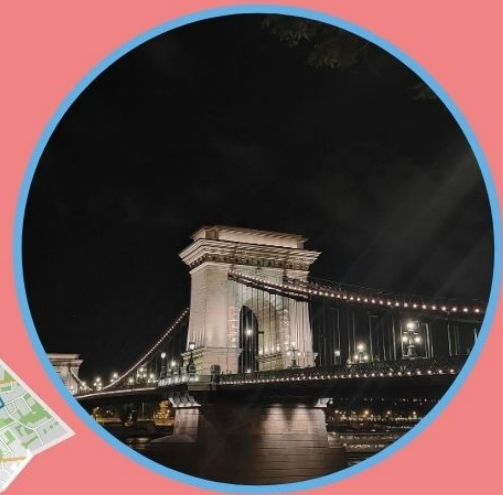
PONTE DAS CADEAS