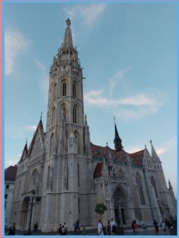
IGREXA DE MATÍAS