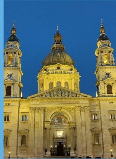
BASÍLICA DE SAN ESTEBAN