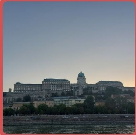
PALACIO DE BUDA