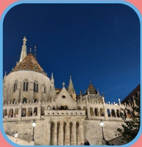
BASTIÓN DOS PESCADORES