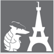
Les Halles de Lyon

La ville de Lyon est la capitale de la gastronomie. Les Halles de Lyon sont bien connues (well known) chez les Lyonnais et les gourmands partout. C'est un marché couvert qui existe depuis 1859. On y trouve des traiteurs, des charcutiers, des fromagers, des boulangers-pâtisseries, des cavistes, des poissonniers, des bouchers, et même des restaurateurs célèbres. En tout, il y a 56 commerçants et artisans qui vendent leurs produits de la meilleure qualité.