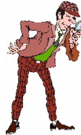
un détective privé