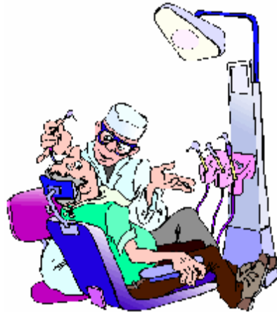
il exerce une profession libérale