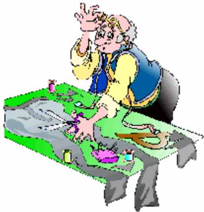
C'est un artisan