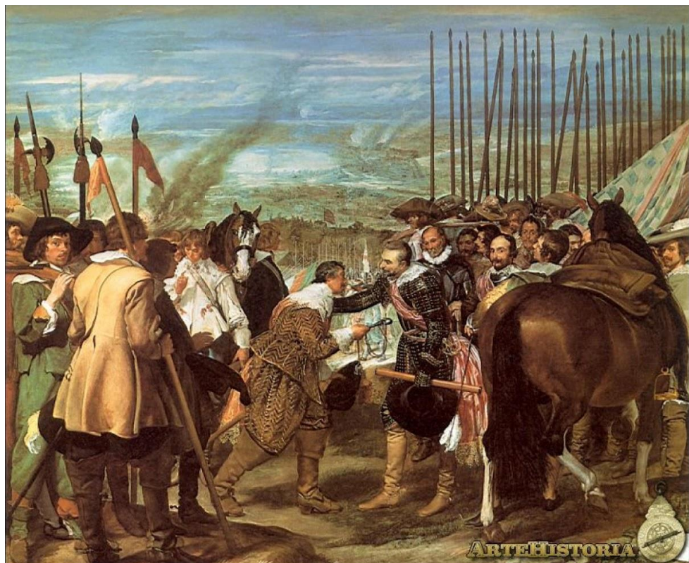
LA RENDICIÓN DE BREDA de Velázquez