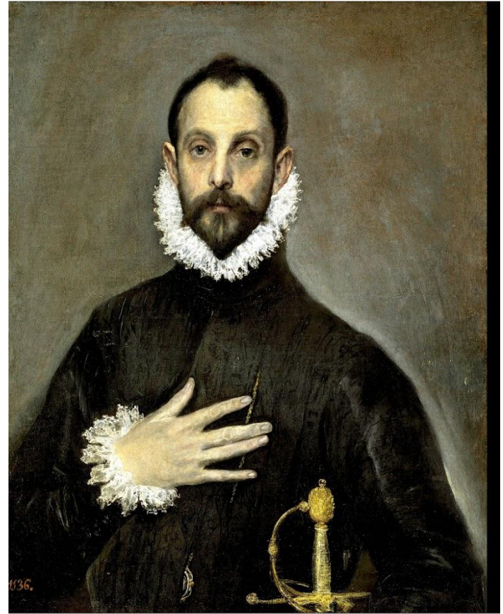
El caballero de la mano en el pecho de EL GRECO