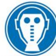
Protección obligatoria de las vías respiratorias