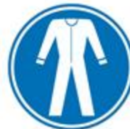
Protección obligatoria del cuerpo