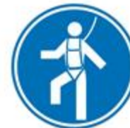
Protección obligatoria individual contra caídas