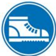
Protección obligatoria de los pies