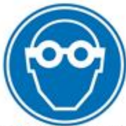
Protección obligatoria de los ojos

1. Obligación: indican que hay que utilizar protecciones para evitar accidentes. Tienen las figuras y los bordes de color blanco, el fondo de color azul y las formas son circulares.