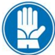
Protección obligatoria de las manos