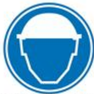
Protección obligatoria de la cabeza