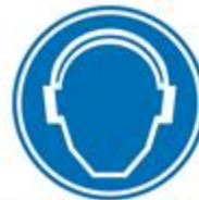
Protección obligatoria de los oídos