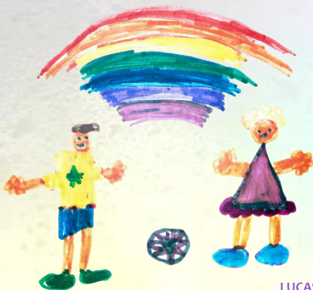
LUCAS, 7 AÑOS