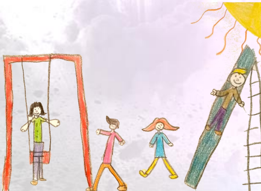
PABLO, 10 AÑOS