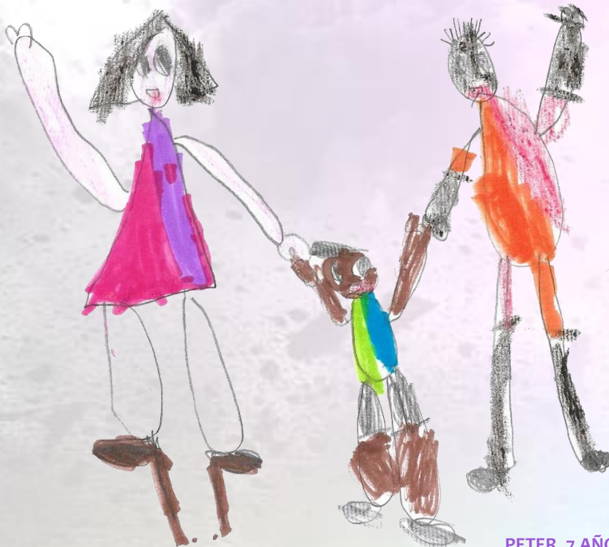
PETER, 7 AÑOS