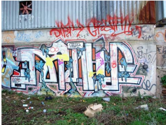
Dirty ( Estilo lixo)