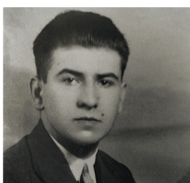
CC aos 15 anos no primeiro ano de universidade. Arq. PG

Acabado o Bacharelato, vai para Compostela. Primeiro ano de universidade.