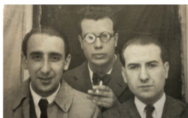
Cunqueiro, Del Riego e CC (Compostela). Arq. PG

1929 Política | Primeira palestra como conferencista “En torno a las ideas comunistas de Platón”