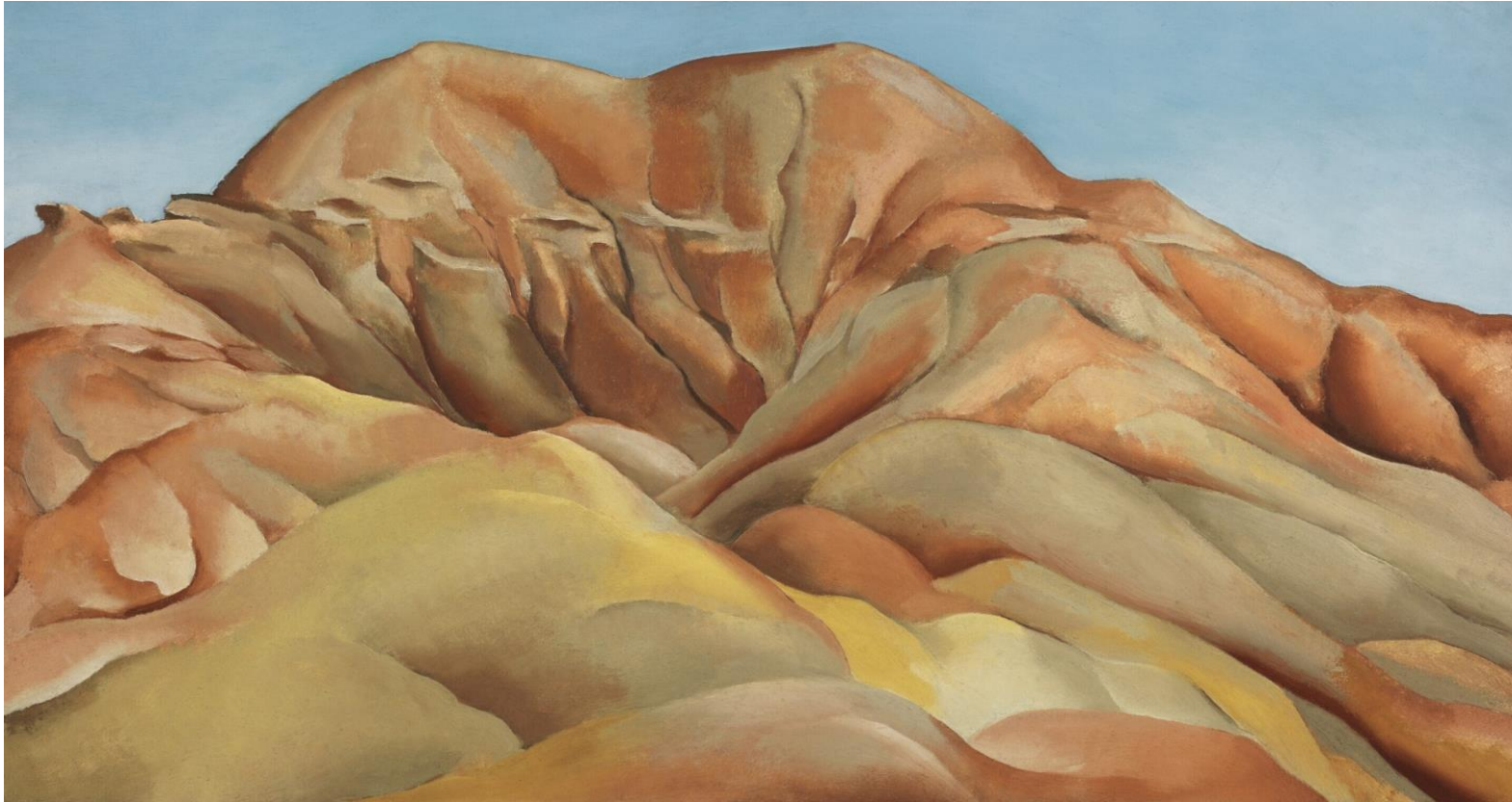
Na vella estrada de Santa Fe, 1930-1931, Georgia O'Keeffe

Georgia O'Keeffe, pioneira da arte moderna americana, desempeñou un papel crucial na evolución artística do século XX. Tiña unha incrível habilidade para plasmar unha visión única da paisaxe estadounidense.