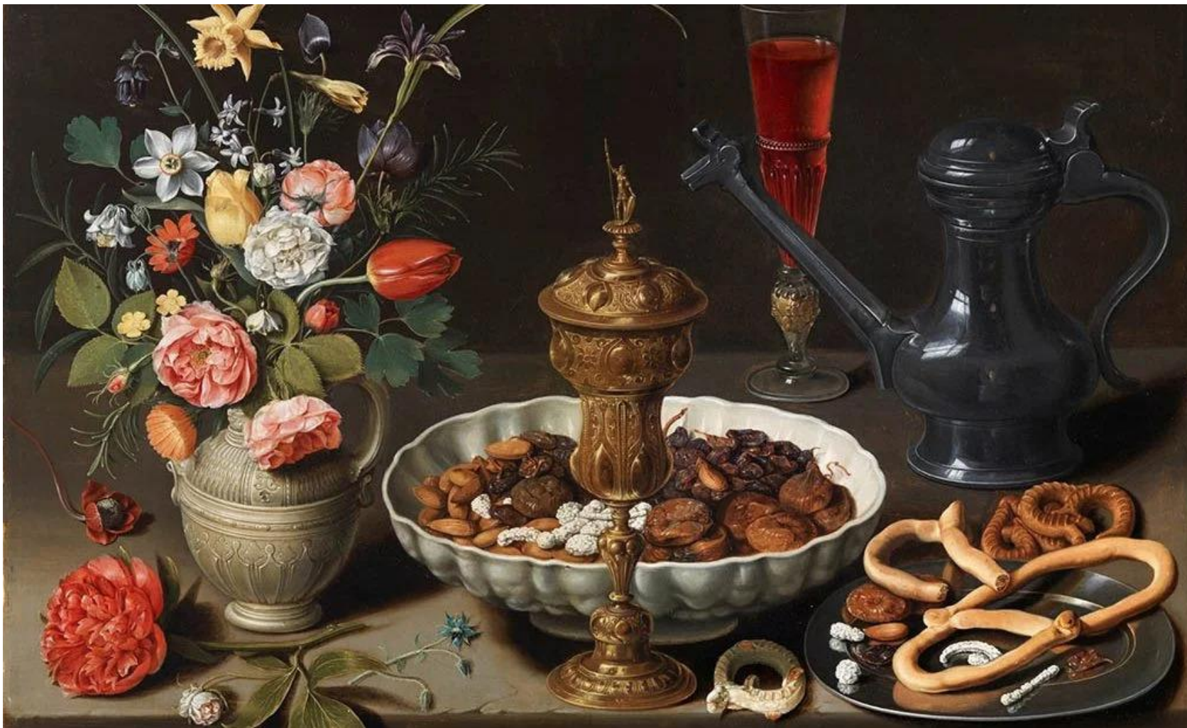
Bodegón (1611). Clara Peeters

Clara Peeters ou Clara Lamberts foi unha pintora flamenca considerada unha das iniciadoras do bodegón ou natureza morta nos Países Baixos.