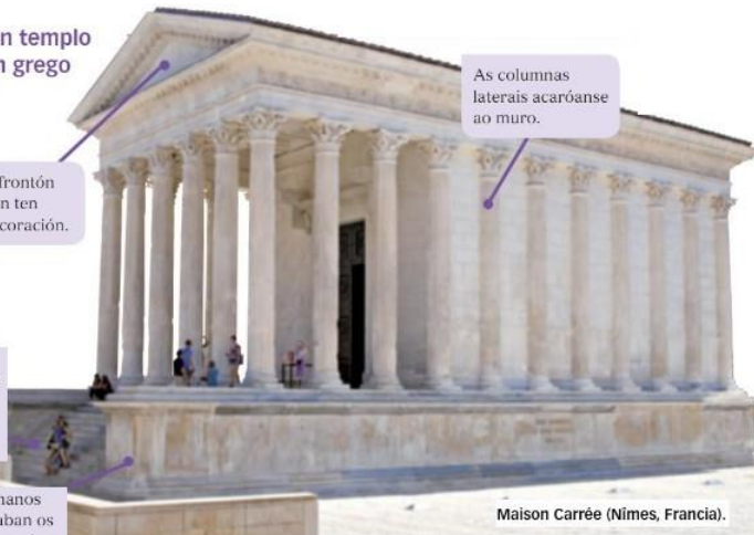
Maison Carrée (Nîmes, Francia).

Os romanos levantaban os templos sobre un podio.