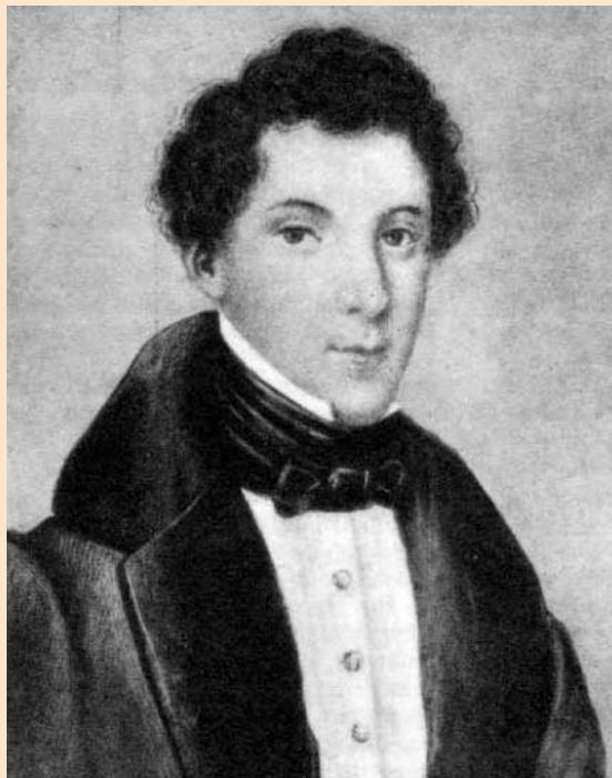
Juan Crisóstomo Arriaga