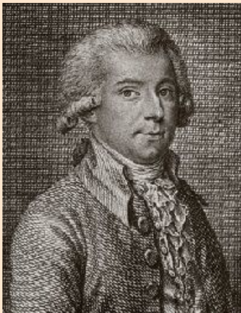
Vicente Martín y Soler