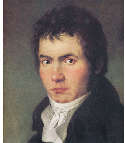
Beethoven cando empezou a compoñer a Quinta Sinfonía

Esta sinfonía e o motivo en particular, son conocidísimos mundialmente. Aparece en xéneros de música disco e rock and roll e tamén fai aparicións en películas e televisión.