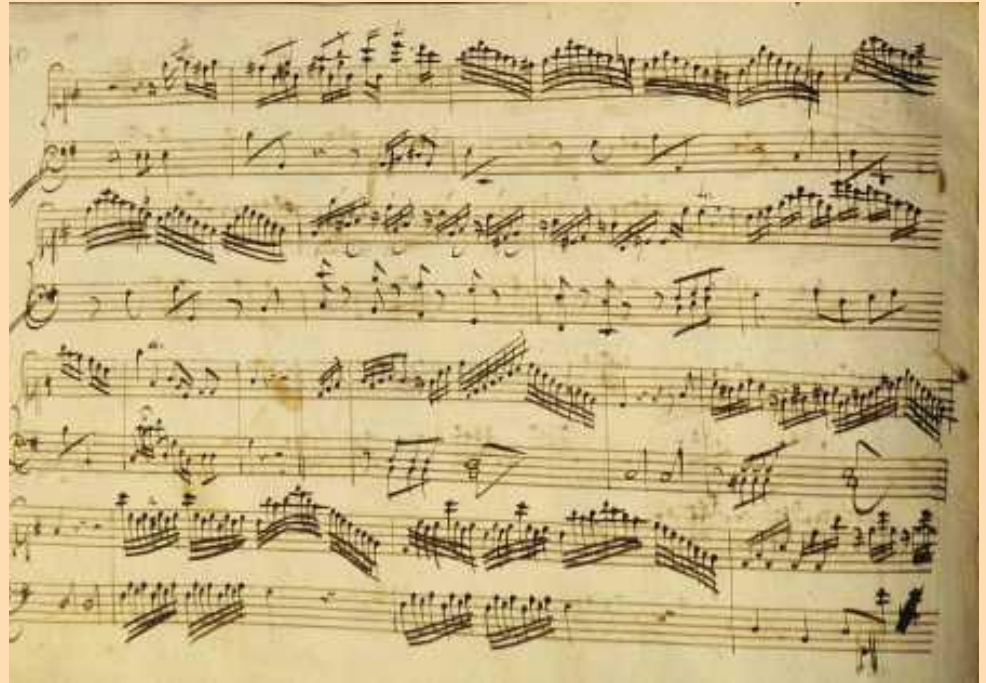
Exemplo de partitura (Mozart)