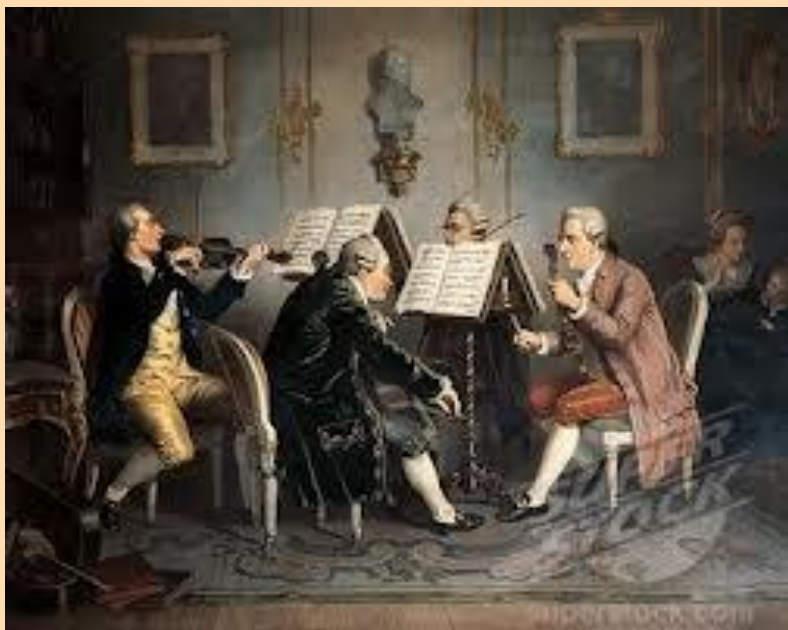
Cuarteto de corda

➡ Imponse o escrito sobre o improvisado . A escritura musical era complexa, polo que comezaron os ensaios e apareceu un director de orquestra.