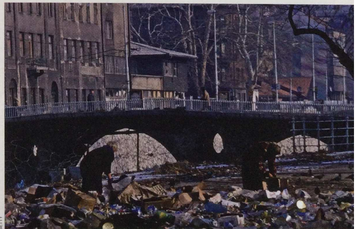
Sobre estas líneas, unas mujeres rebuscan comida entre la basura durante el sitio de Sarajevo, el más largo de la historia moderna.

Cuando concluyó el asedio, la población se había reducido en casi un 35%. El 85% de las víctimas fueron civiles; entre ellas se encontraban las que fallecieron en las masacres del mercado de Markale, donde perecieron 68 civiles en un primer ataque y 43 años y medio después. En respuesta a esos actos, la ONU emitió un ultimátum y comenzó el fin del asedio: se declaró un alto el fuego en octubre de 1995 y los Acuerdos de Dayton llevaron finalmente a la paz.