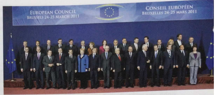
Os xefes de Goberno da UE reunidos en Bruxelas para un cumio do Consello Europeo en 2011. 12 destes países son antigas democracias populares ou ex repúblicas soviéticas.

Doutra banda, a reunificación alemá integrou na CEE a antiga RDA e formulou o futuro do resto de países do Leste neste organismo. A creación en 1992 da Unión Europea tivo xa en conta a integración destes países no novo proxecto económico e político de Europa . No caso de Rusia, mantéñense relacións comerciais, pero o peso territorial, económico e mais demográfico ruso podería chegar a desestabilizar o conxunto da UE e provocar dificultades para a súa posible integración.