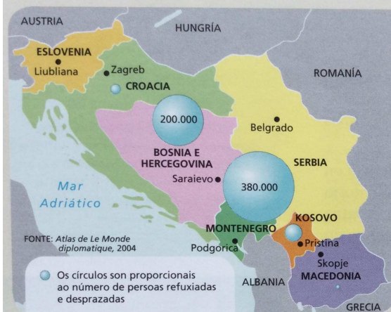
Doc. 18 Desprazamentos de poboación na antiga Iugoslavia.

J. CASASSAS (coord.), A construción do presente: o mundo de 1848 aos nosos días , 2005