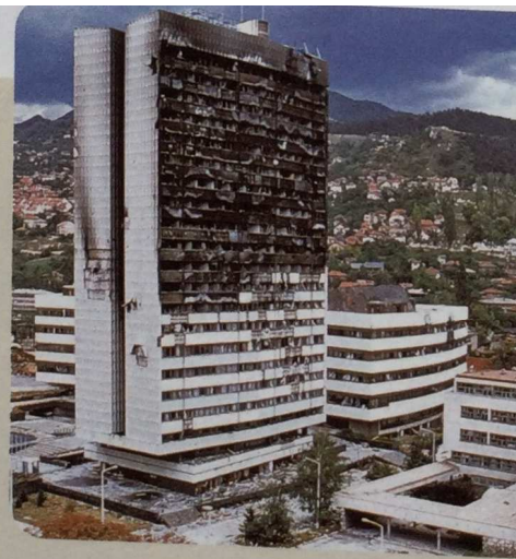
Vista de Saraievo tras os bombardeos serbios.

A guerra de Bosnia e Hercegovina foi o conflito máis cruel e no que a poboación civil sufriu máis abusos e persecucións. Soamente a intervención da OTAN entre 1994 e 1995 puido frear as hostilidades.