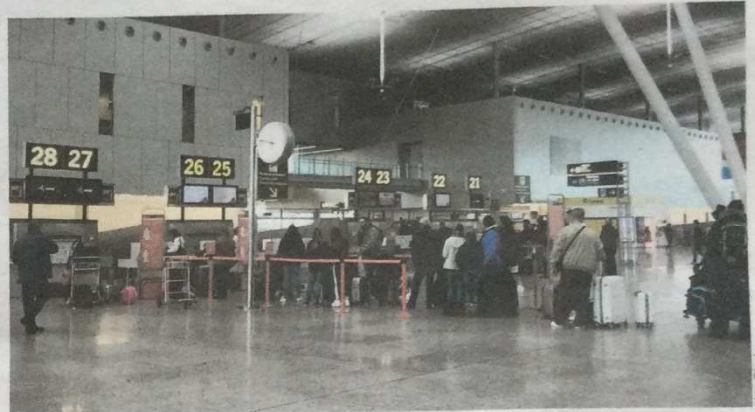
Viaxeiras e viaxeiros no aeroporto de Lavacolla.