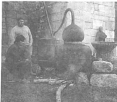
A elaboración da caña é todo un ritual que cada ano repite nos lugares coa finalidade de atesourar o preciado produto que servirá para agasallar ós amigos e ós festeiros.

Coa nova regulamentación establecida polo Estado para a elaboración de bebidas alcohólicas destiladas, e que supoñen un paso adiante á equiparación coas que rexen desde anos en toda Europa, vótase un forte atranco á tradicional produción caseira da augardente, máis coñecida entre nós por "caña".