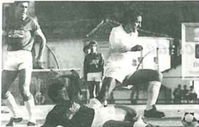
Supremo: El Centro Gallego

Nomeouse un comité formado por un presidente, un secretario e un vocal de cada