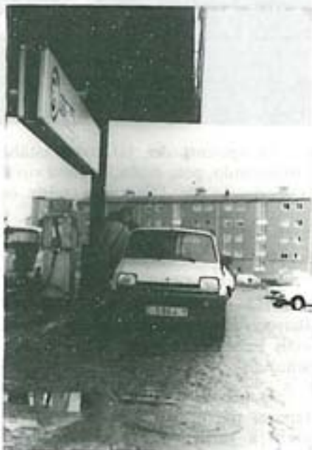
A baixada da gasolina, regalo de reis do ano 1986

agraciado, máis riseiro. De principio, trae dous importantes regalos herdados do sacrificio 85: a alentadora baixada da gasolina e os bos resultados da inflación que transmiten unha certa confianza nas medidas adoptadas polo goberno. Logo, as dúas tenazas que teñen asfixiada a nosa economía: o alto precio do dólar e o custo do petróleo, presentan claros síntomas de tendencia á baixa e permiten acometer con certo optimismo a implantación do I.V.E.