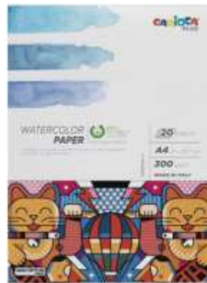
Blocs de 20 y 30 hojas