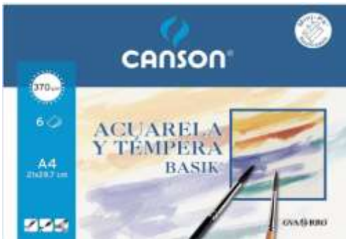
Sobre de 6 hojas

-LÁMINAS para ACUARELA/TÉMPERA TAMAÑO A4 Vale cualquier papel para técnicas húmedas de 300 gr o más. Se pueden juntar varios alumnos/as para comprar un bloc (como los dos del ejemplo u otros similares). Con 5 ó 6 hojas por alumno/a será suficiente para todo el curso.