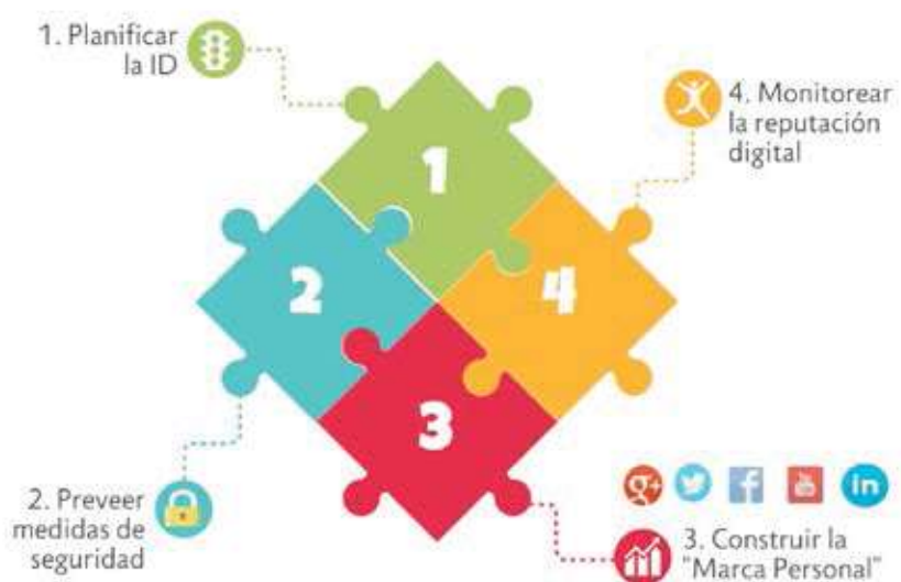
FIGURA 1: ETAPAS PARA LA GESTIÓN DE LA IDENTIDAD DIGITAL

De esta manera, en la figura 1, se propone cuatro etapas que el docente debe realizar para gestionar eficazmente su identidad digital.