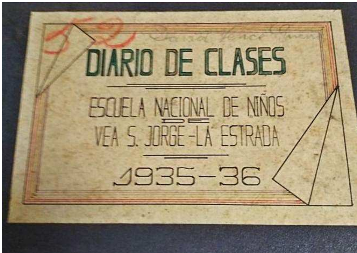
Portada e unha páxina deste diario da escola de San Xurxo de Vea, difundidas nunha rede social.

Ana Cela Faro de Vigo. A Estrada 04.09.2020